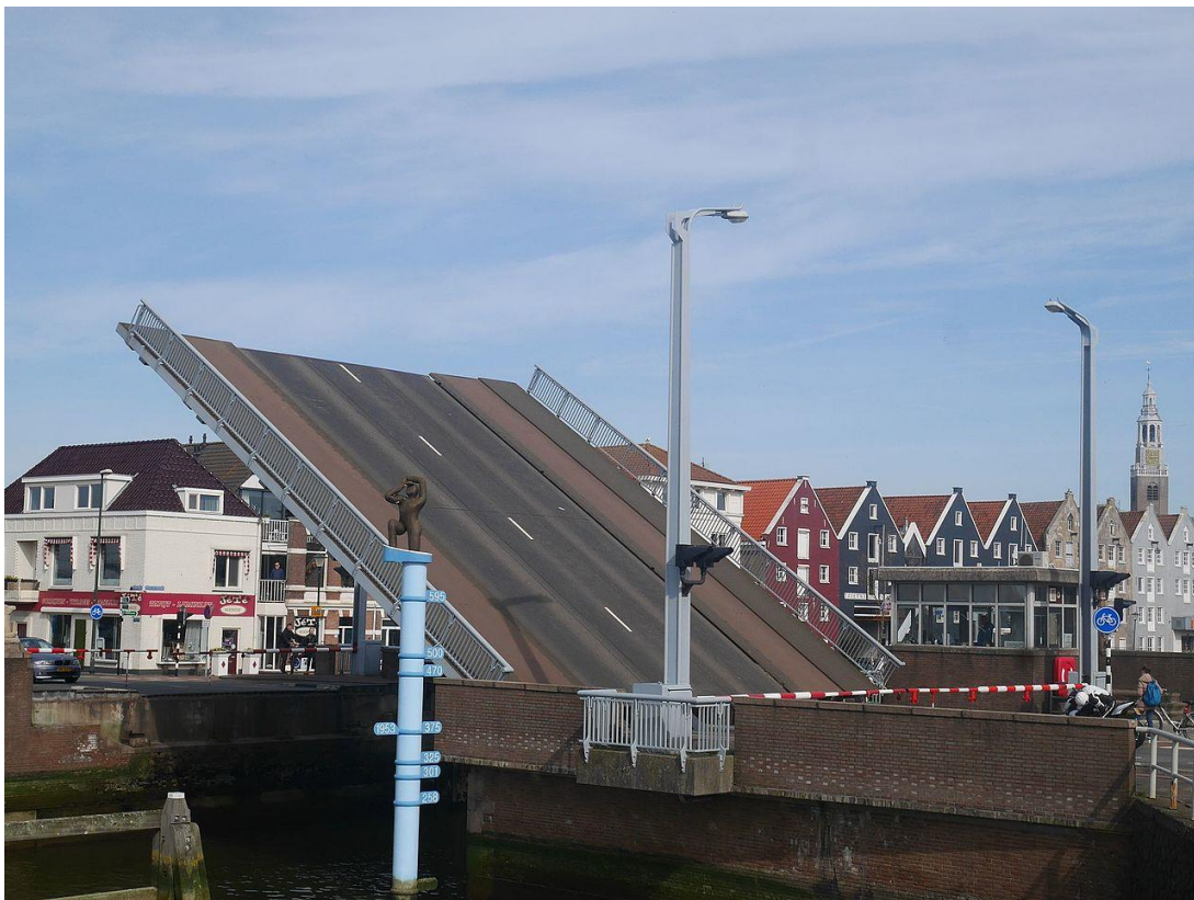
Afbeelding 1. De bestaande basculebrug