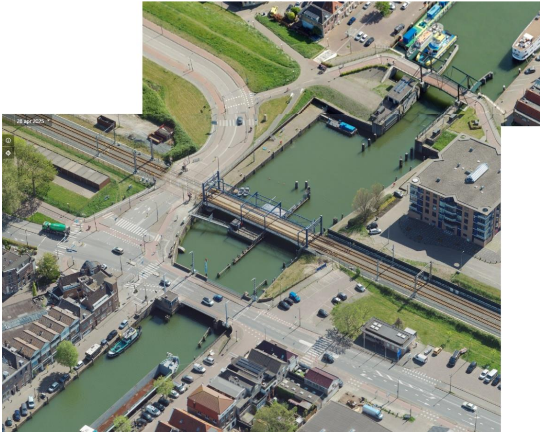
Afbeelding 2. Bovenaanzicht drie bruggen over Hellinggat, van onder (noordzijde) naar boven Koepaardbrug, Havenspoorbrug en Coppelbrug.