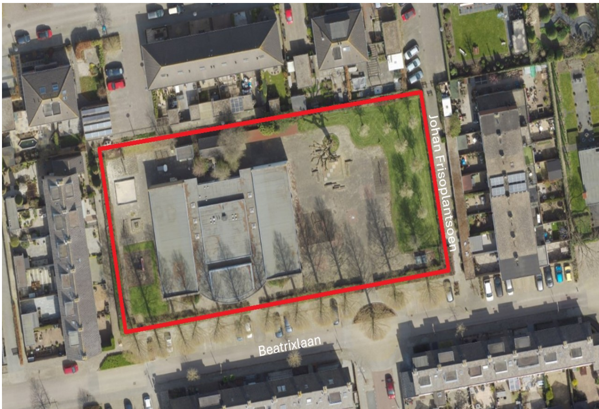
Figuur 2.1: Projectlocatie, indicatief weergegeven

Het plangebied is gelegen in Moerkapelle en wordt begrensd door de Beatrixlaan, Prins Clausplantsoen, Johan Frisoplantsoen en de Van Swaanswijkstraat.