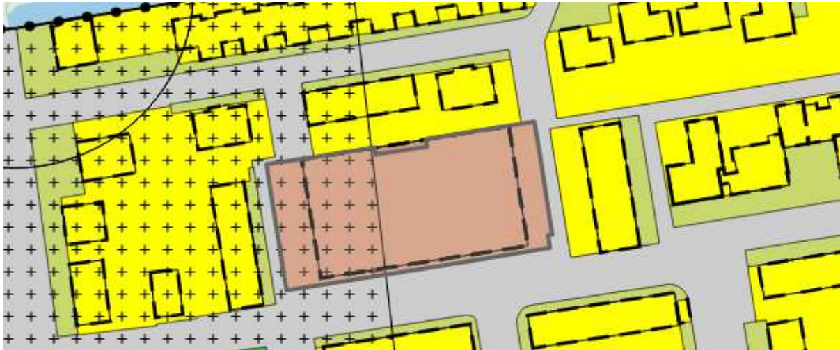
Figuur 3.1: Uitsnede bestemmingsplan Moerkapelle Dorp

Op basis van het vigerende planologisch kader is wonen niet toegestaan. Er moet een ruimtelijke procedure doorlopen worden om de ontwikkeling mogelijk te maken.