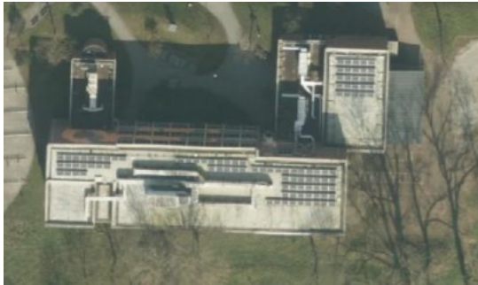
Bovenaanzicht gebouw Ocean

De meest recente inspectie heeft plaatsgevonden in 2022 en dient weer in 2027 te worden uitgevoerd.