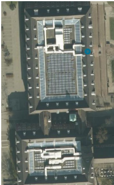
Bovenaanzicht gebouw Horizon