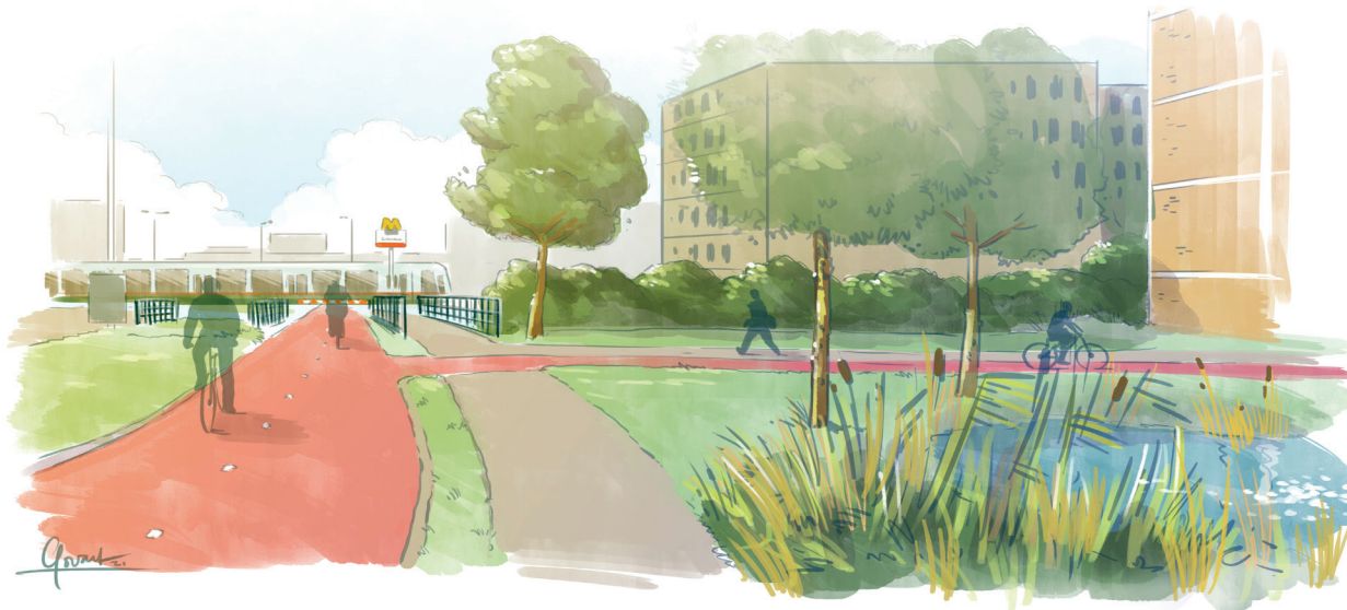
Impressie De verbinding naar het metrostation verbeteren

We verbeteren de verbinding met metrostation Schenkel. Door het fietspad aan de noordzijde van de Kralingseweg én het fietspad vanaf de Kralingseweg naar de Dotterlei te verbreden, ontstaat er ruimte voor tweerichtingsverkeer op de fiets. Aan de noordzijde van de Kralingseweg tot de Schenkelse Dreef leggen we een voetpad aan waar nu nog geen stoep is. Hiervoor moet er ook een nieuw brug over de sloot komen.