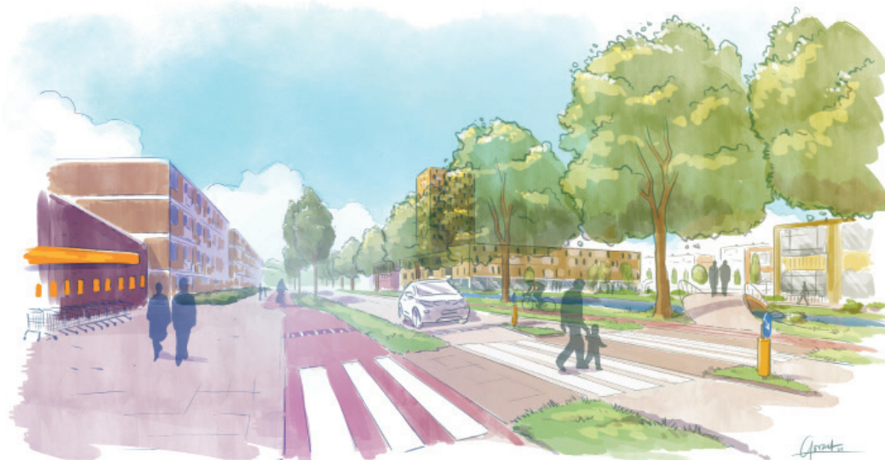
Impressie Veilig de Schenkelse Dreef oversteken

Er moeten fijne en veilige wandelroutes zijn tussen de basisscholen, de winkels, het buurtpark en de woningen. Daarom gaan we onder andere de oversteekplaatsen voor voetgangers en fietsers op de Schenkelse Dreef veiliger maken en op logische plekken aanleggen. Dat doen we als onderdeel van een nieuwe inrichting van de Schenkelse Dreef in de Florabuurt. Ook verbreden we de fietspaden en plaatsen we bomen aan de oostzijde van de weg.