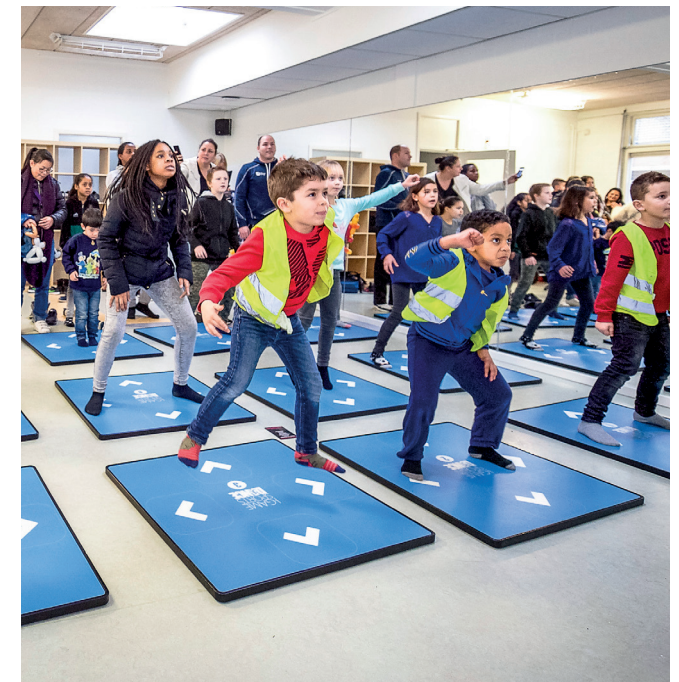
We maken een gezondere leefstijl makkelijker en leuker

We maken een gezondere leefstijl makkelijker en leuker, zodat bewoners een betere gezondheid hebben en ervaren. Zodat zij zich vitaal voelen, kunnen participeren en minder zorg nodig hebben. We zetten in op een gezonde voeding (ook met een beperkt budget) en vermindering van het aantal rokers. Gecombineerd met het kunnen omgaan met stress en het vergroten van oplossingsvermogen. We richten ons op alle bewoners van de Florabuurt met speciale aandacht voor moeilijk bereikbare bewoners in een kwetsbare situatie en bewoners die we al kennen via bestaande activiteiten en locaties, zoals de inloop GGZ, het Huis van de Wijk, het Wijkrestaurant en de huisarts. We zorgen voor een kwalitatief goede buitenruimte met mogelijkheden om te ontmoeten, te sporten en te spelen.