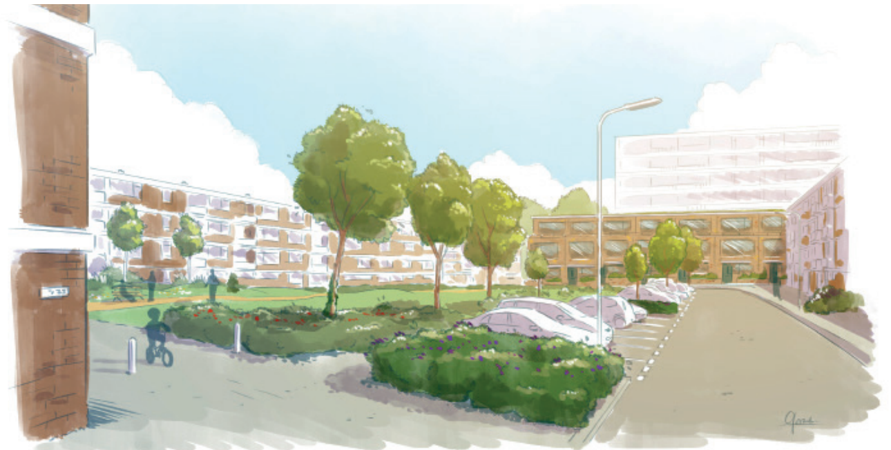
Impressie Aan de Wingerd zien we mogelijkheden om ongeveer 8 woningen te bouwen.

De Florabuurt wordt een buurt waar iedereen een woning kan vinden. Zowel jongeren als ouderen. Zowel bewoners met een laag inkomen als bewoners met een (midden-)hoog inkomen. Om dit mogelijk te maken bouwen we verschillende soorten nieuwe woningen. We bouwen vooral woningen voor groepen met een modaal inkomen zoals leraren, verpleegkundigen en agenten. Bij het toevoegen van woningen letten we goed op de gevolgen voor verkeer en parkeren. Plannen moeten zelf voor parkeeroplossingen zorgen. Met de komst van nieuwe bewoners versterken we het draagvlak voor voorzieningen zoals de winkels en basisscholen. Tot slot helpt de bouw van nieuwe woningen bij het bestrijden van het woningtekort in onze regio. De gemeente Capelle aan den IJssel en Havensteder hebben afgesproken om in de Florabuurt 56 nieuwe sociale huurwoningen te bouwen. Het gaat om ruime