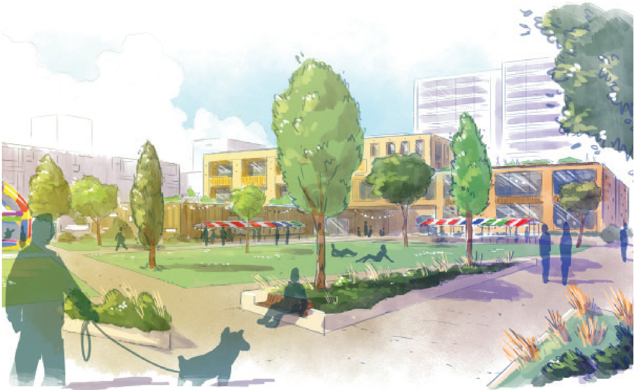
Impressie In het midden van de Florabuurttown komt een nieuw buurtpark. Het wordt dé ontmoetingsplek voor de Florabuurttown.