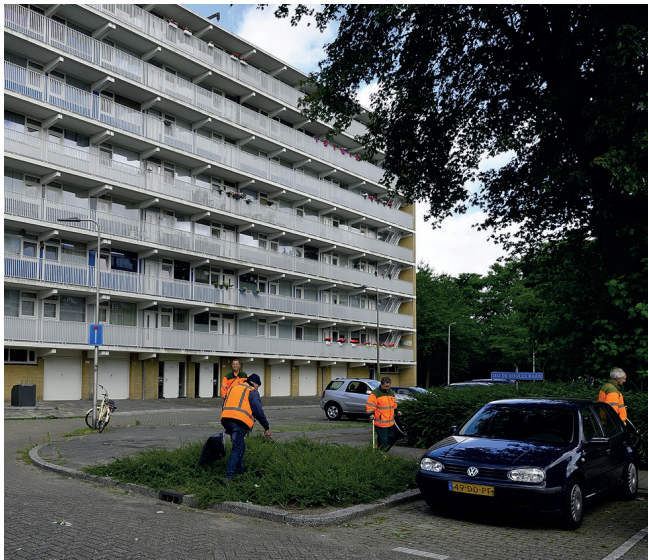
Er is in de buurt werk te creëren in het groenonderhoud

Via een bewonersbedrijf willen we buurtbewoners van de Florabuurt met een afstand tot de arbeidsmarkt helpen aan een veilige werkomgeving in hun eigen buurt. Met begeleiding indien nodig, eventueel gekoppeld aan opleidingen/(taal)cursussen en kinderopvang. Een deel van deze mensen kan hierin blijvend een plek vinden, anderen kunnen doorstromen naar een reguliere baan. Er is in de buurt werk te creëren in bijvoorbeeld de schoonmaak, (groen) onderhoud, koken in het wijkrestaurant of locatiebeheer. Het bewonersbedrijf kan ook een rol hebben in het aanjagen en begeleiden van buurtinitiatieven. We onderzoeken samen met partners of het oprichten van een bewonersbedrijf in de Florabuurt haalbaar is.