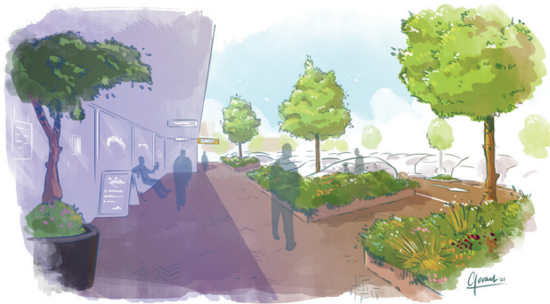
Impressie Verbetering van de uitstraling winkelstrip