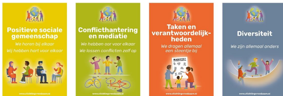
De Pijlers van de Vreedzame Wijk

Samenleven is namelijk iets wat je kunt leren. Met de Vreedzame Wijk willen we kinderen en jongeren leren wat het betekent om in een democratische samenleving op te groeien. We proberen ze hier actief op voor te bereiden: heel concreet door hoe ze hun stem kunnen laten horen, maar ook luisteren, en hoe ze hun steentje kunnen bijdragen aan het gemeenschappelijk belang. Door democratische burgerschapsvaardigheden te leren en te oefenen, voelen ze dat zij ertoe doen. Sociale verantwoordelijkheid en daadkracht maakt hen sterk.