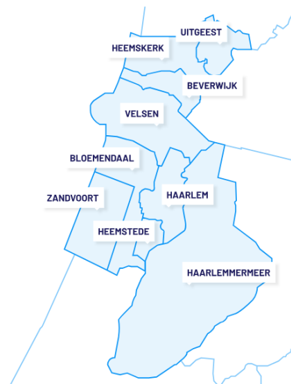
Afbeelding 1 Veiligheidsregio Kennemerland

VRK zorgt in dit gebied voor coördinatie van hulpdiensten en crisisbeheersing. Het doel is veiligheid en gezondheid voor alle inwoners.