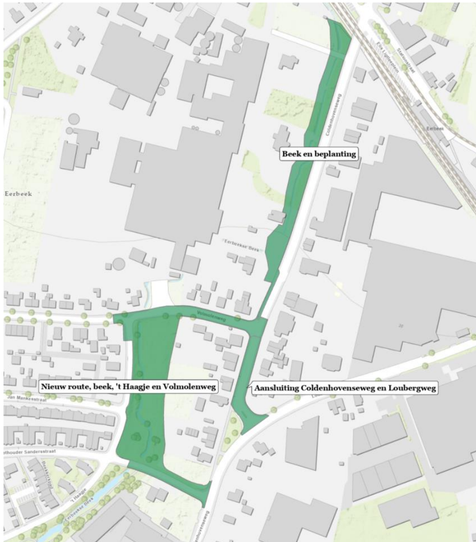
Figuur 2.2: Begrenzings projectonderdelen

Het laatste deel van het project bevat het zichtbaar maken van de Eerbeekse Beek op het terrein van FBE; de werkzaamheden bestaan vooral uit het aanpassen van de beplanting. Op figuur 2.2 staan de projectonderdelen weergegeven.