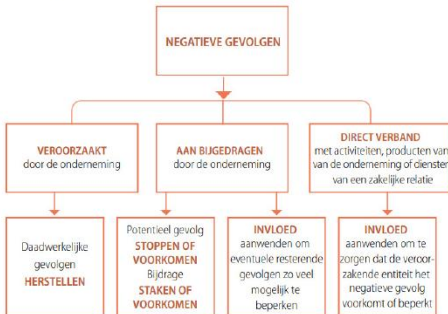
Figuur 2: Aanpakken van negatieve gevolgen.