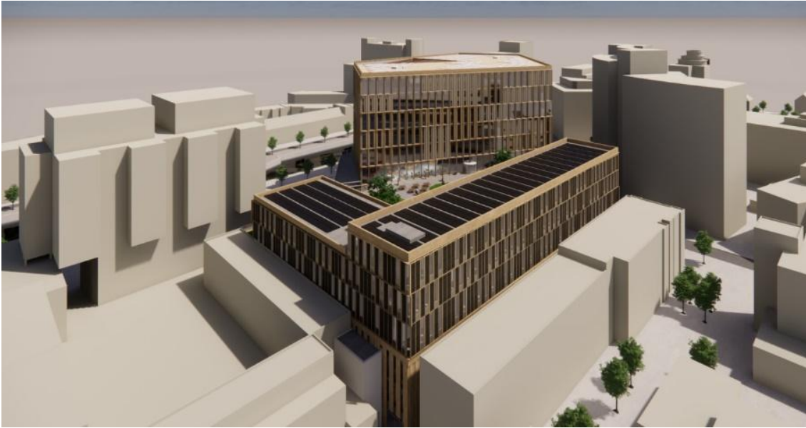
Impressie van de belendende gebouwen aan de achterzijde van het project, op de voorgrond de Plateaukantoren.