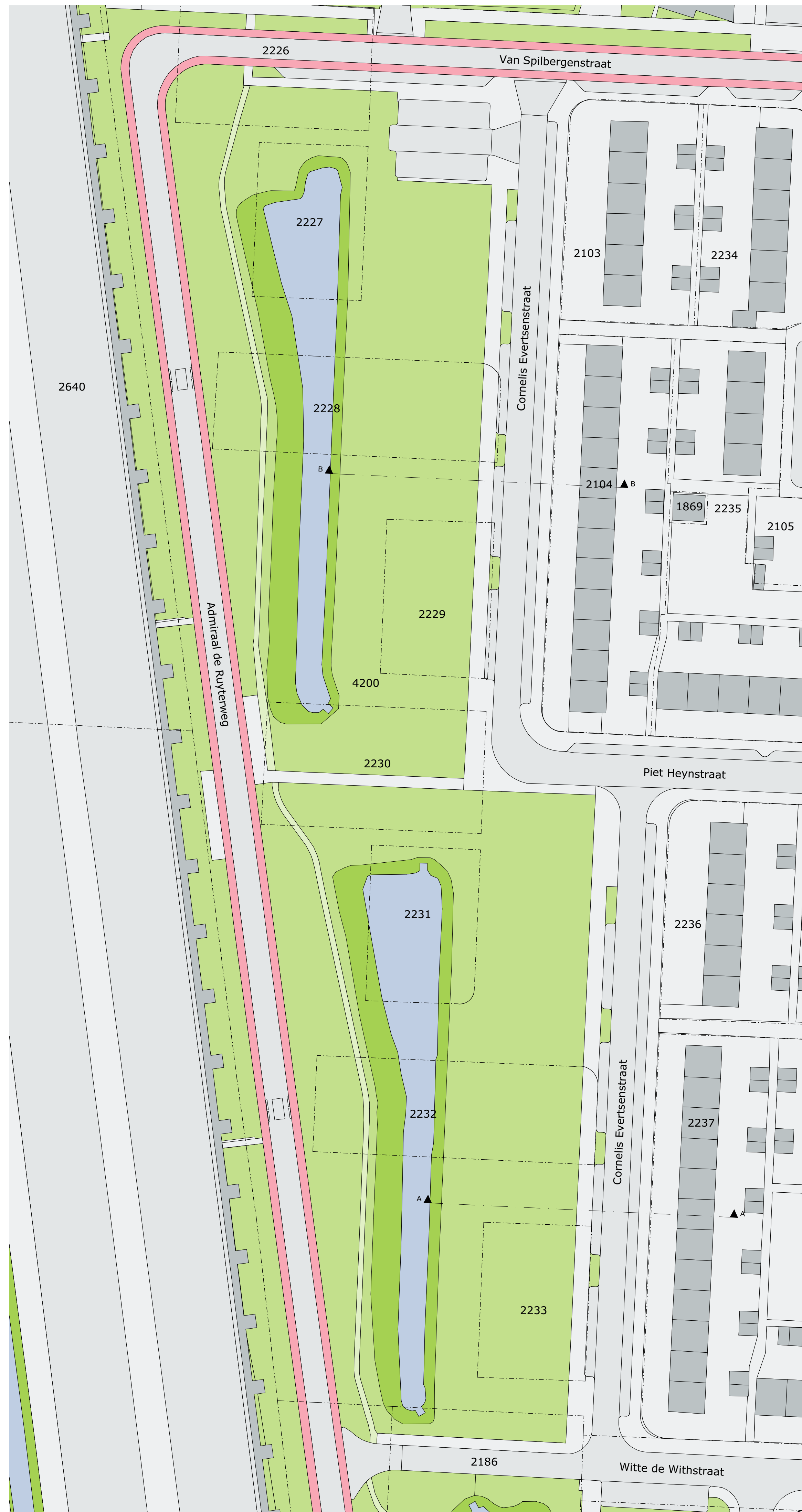
SITUATIE - BESTAAND