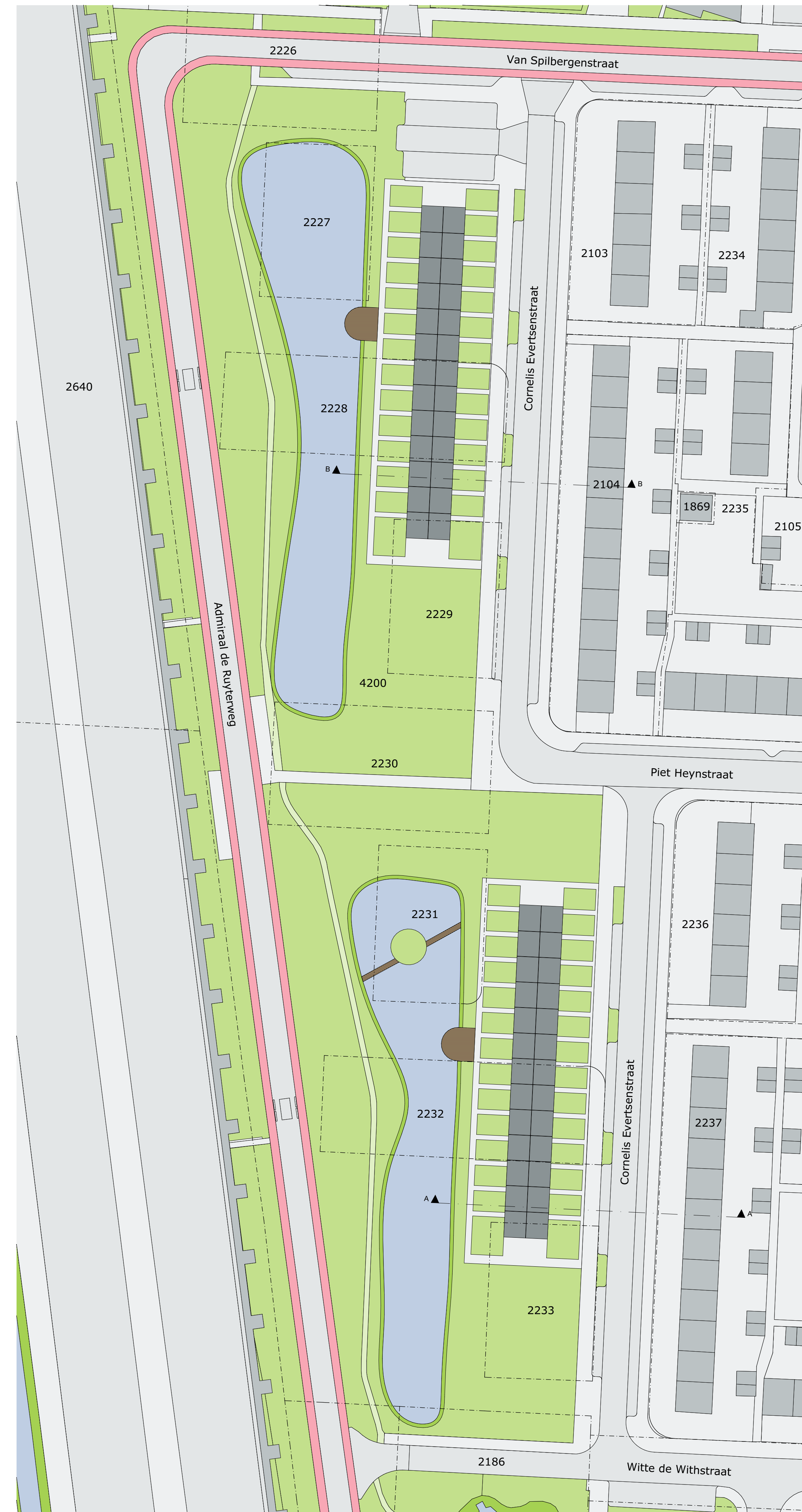
SITUATIE - NIEUW