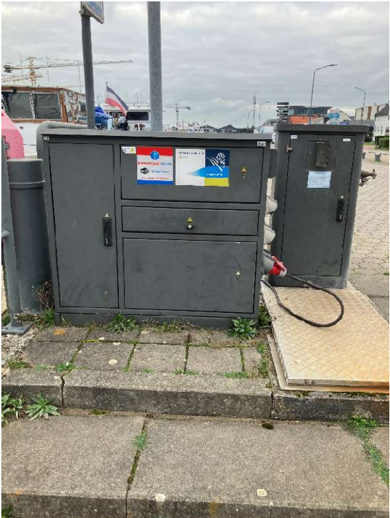
Gemeentekade Biesboschhaven Zuid thv huisnummer 20 Nieuwe kast aansluitingen 1x16a, 3x32a en 2x63a + watervoorziening