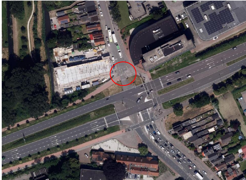
2 Omcirkeld de locatie van de dynamische afsluiting aan de noordkant van het Keern.

De komst van de stadstoegang betekent ook dat de dynamische afsluiting bij het Keern komt te vervallen. Dit heeft invloed op lijn 133. (zie ook punt 4a)