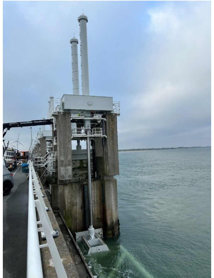
Figuur 2 Volledig uitgeschoven cilinder