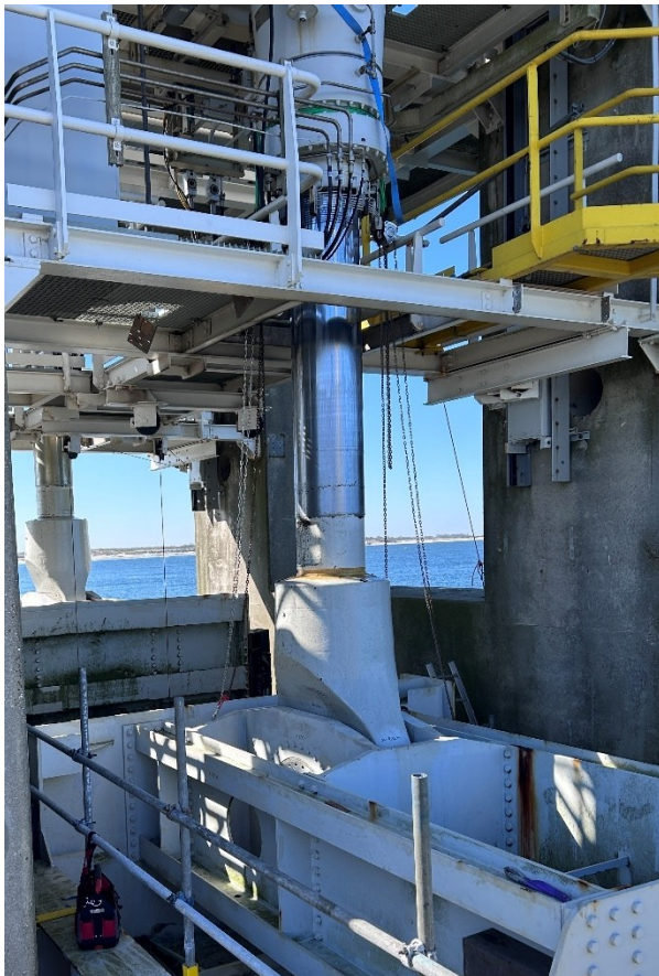
Figuur 1 Cilinder in standaard positie (120 cm uitgeschoven)

Optioneel is een onderhoudsvervolgfase waarbij contracteren omtrent Meerjarig Onderhoud (MJO) wordt vormgegeven.