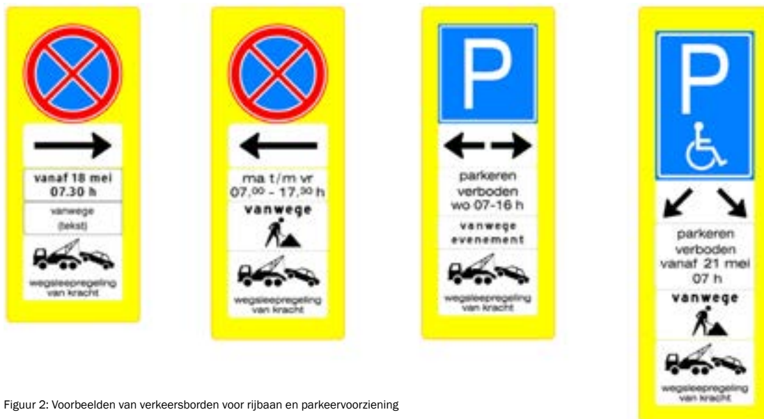
Figuur 2: Voorbeelden van verkeersborden voor rijbaan en parkeervoorziening