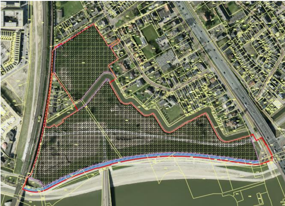
Figuur 1: Concept plangebied en demarcatiegrenzen. Zie tevens bijlage 2