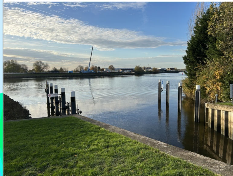
Remmingwerk Hollandsche IJssel zijde