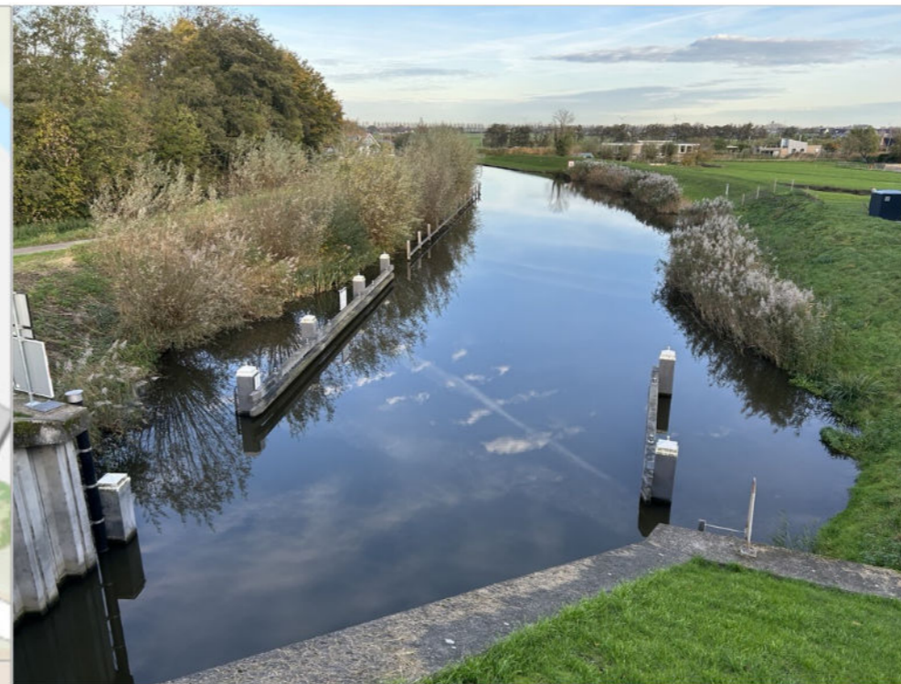
Remmingwerk Ringvaart zijde