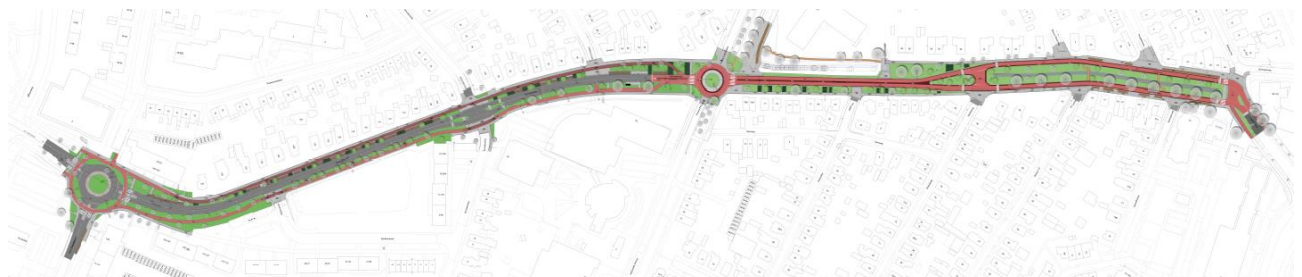
Figuur 2 Voorlopig ontwerp Sprengenweg.

De gemeente Apeldoorn heeft het definitief ontwerp uitgewerkt. Het definitief ontwerp wordt door de gemeente uitgewerkt tot bestekstekeningen en een RAW bestek. Het hoofdstuk 'fasering' wordt in het bouwteam nader uitgewerkt.