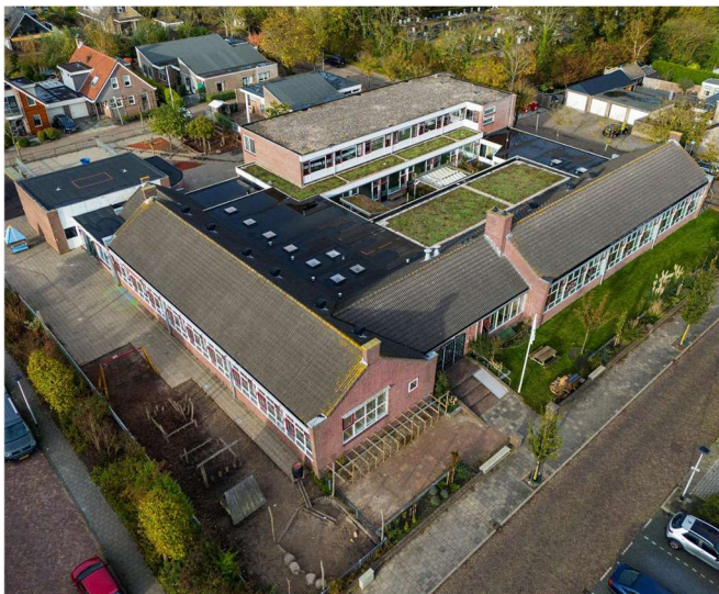
Figuur 1: Bestaande situatie

De kinderopvang is momenteel deels in pandig en deels in het bijgebouw op het terrein gehuisvest. Het voornemen is om het bijgebouw te slopen en de kinderopvang volledig te integreren in de school. Het bijgebouw heeft een bruto vloeroppervlakte van circa 182 m 2 .