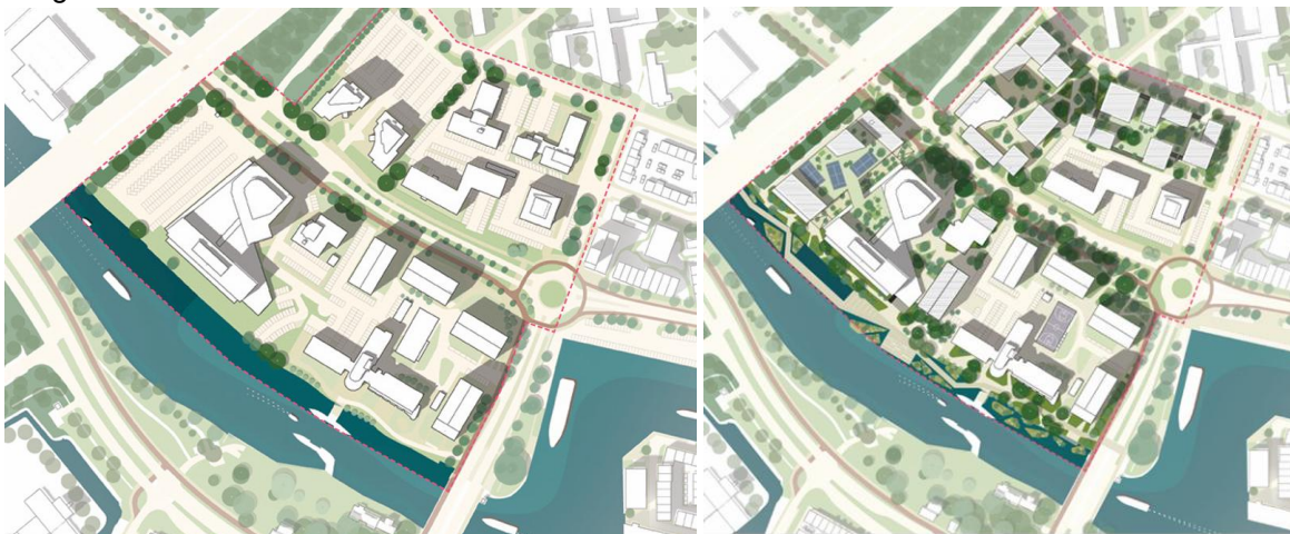
Afbeelding: overzicht bestaande en toekomstige situatie Roelenkwartier, stap 1

Door te verdichten is er in het Roelenkwartier ruimte voor circa 500 extra woningen, werkplekken en voorzieningen. Daarbij wordt er meer en betere verblijfsruimte gecreëerd en zal het gebied vergroenen. Bestaande kantoorgebouwen zullen deels een transformatie krijgen naar wonen/werken en door het parkeren onder te brengen in mobiliteitshubs ontstaat ruimte om extra woningen toe te voegen.