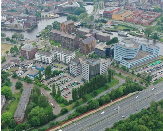
Afbeelding: luchtfoto huidige situatie Roelenkwartier

Het Roelenkwartier is een gebied aan de noordwestzijde van de oude binnenstad. In dit gebied bevinden zich voornamelijk kantoren en appartementengebouwen.