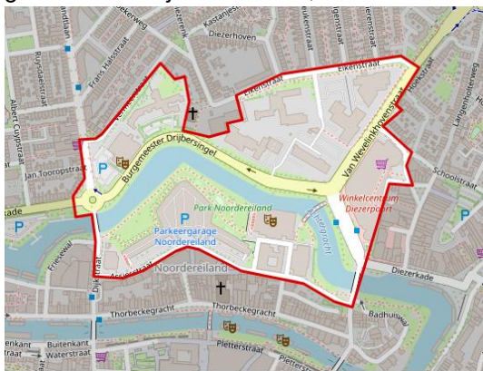
Afbeelding: plangebied Noorderkwartier

Het Noorderkwartier is gelegen aan de noordzijde van de binnenstad tussen de oude Binnenstad en de wijk Dieze. In het gebied bevinden zich onder andere Theater de Spiegel, restaurant De Librije, poppodium Hedon, het kantoor van de Belastingdienst en het gebouw van het Historisch Centrum Overijssel. Ook parkeergarage Noordereiland en parkeergarage en winkelcentrum Diezerpoort zijn onderdeel van het gebied. Dit gebied zal zich in de komende jaren transformeren naar een levendige, groene stadswijk waar wonen, werken en ontmoeten centraal staan.