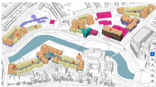
Afbeelding: beoogde eindsituatie gebiedsontwikkeling Noorderkwartier

In het Noorderkwartier komen circa 750 woningen- van appartementen tot gezinswoningen- en er komt ruimte voor lokale cultuur, kleine bedrijven en jonge ondernemers. Ook bestaande gebouwen krijgen een tweede leven. In 2026 wordt op het Noordereiland gestart met de voorbereidende werkzaamheden waarna de bouw van de eerste woningen start in 2027. Het Noorderkwartier zal in de periode tot ca. 2035 gefaseerd ontwikkeld worden.