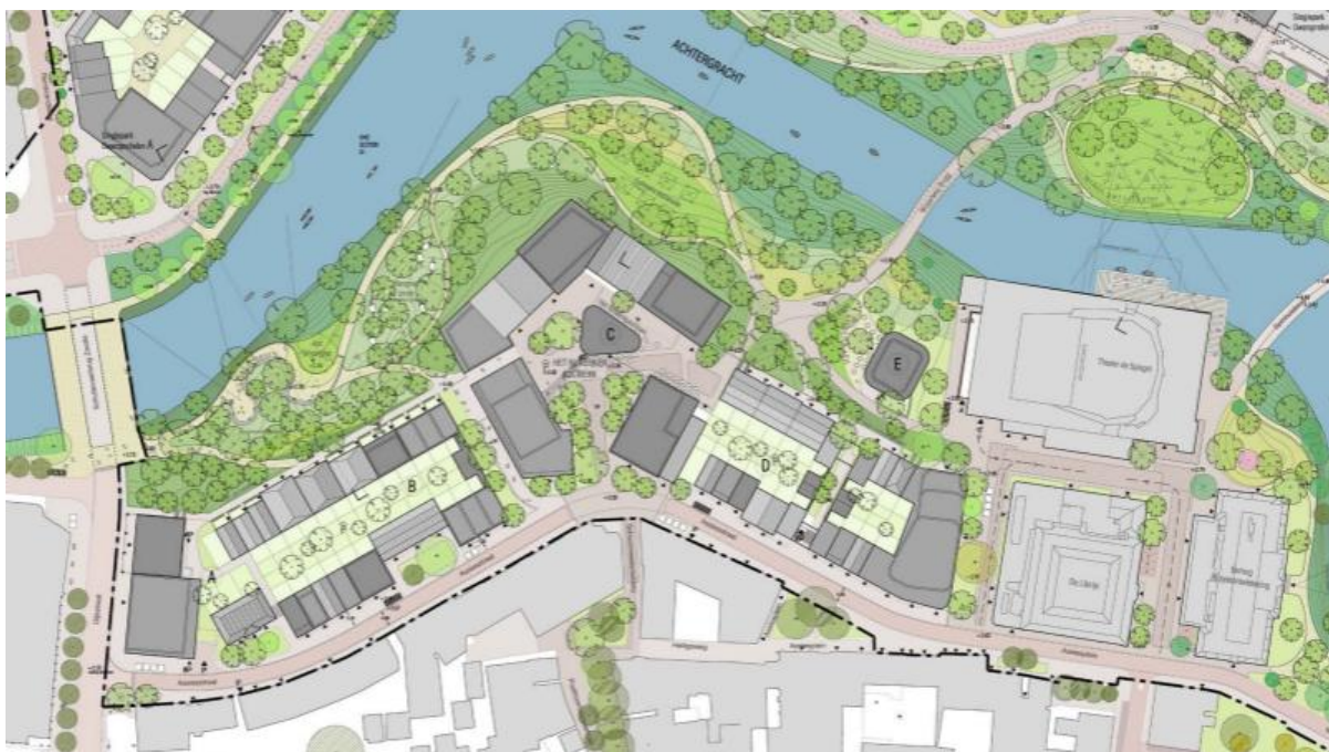
Afbeelding: uitsnede ROP deelgebied Noordereiland