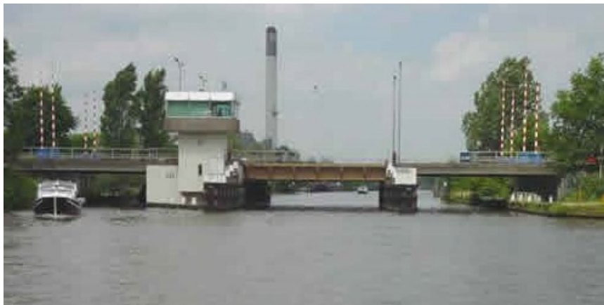
Figuur 1 Greunsbrug

De Greunsbrug vormt een belangrijke verbinding voor zowel wegverkeer binnen de stadsring als voor het vaarverkeer in de doorgaande vaarroute.