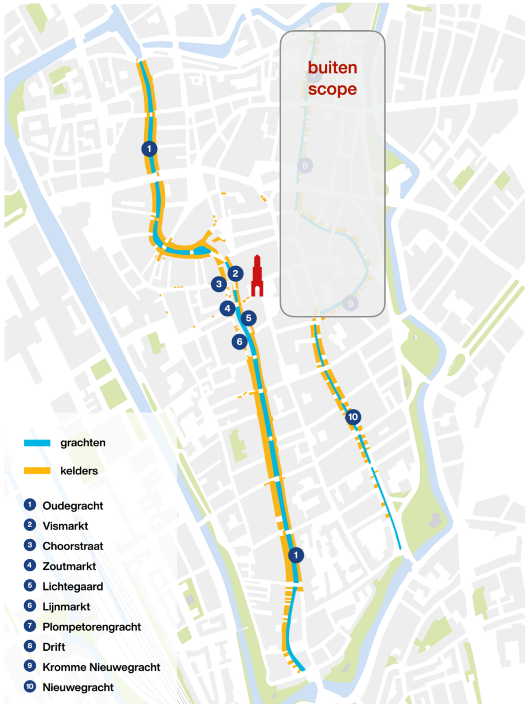
Figuur 2: fysieke scope herstelwerkzaamheden Kelders Wervengebied