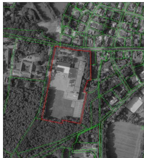
Luchtfoto perceel, omvang ca. 32.500 m 2