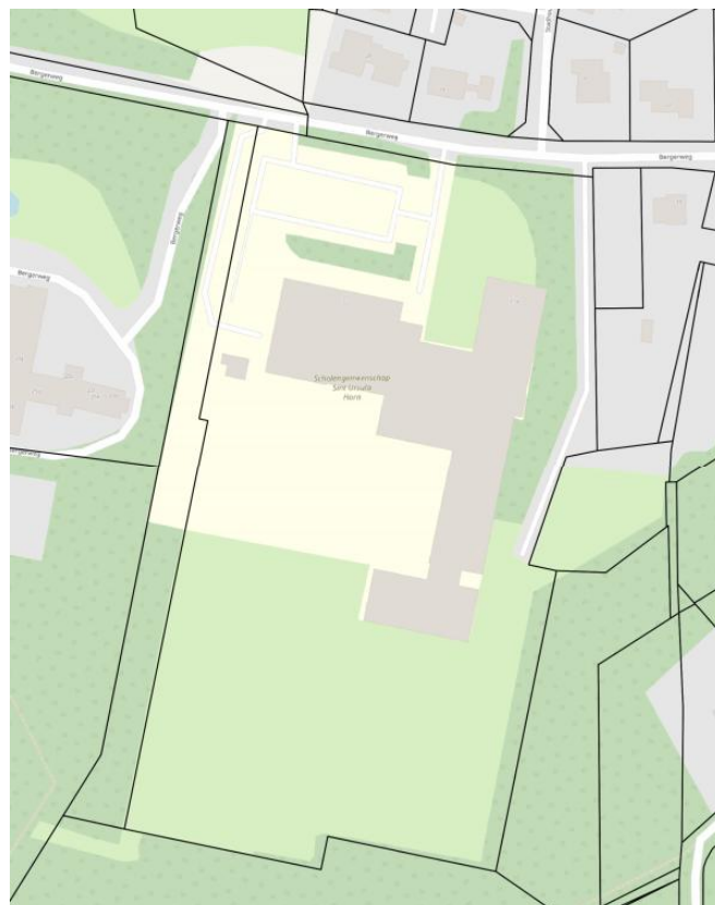
Kaart plangebied (huidige locatie Sint Ursula te Horn aan de Bergerweg 21).