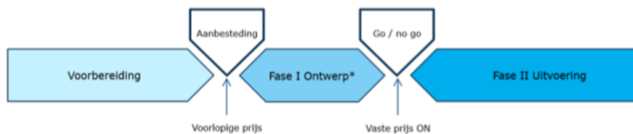
Figuur 3: 2-Fasen aanpak

Fase II wordt bij gunning voorwaardelijk opgedragen (onder opschortende voorwaarden) en gaat alleen door als aan vooraf vastgestelde voorwaarden is voldaan. In het onwenselijke geval dat geen overeenstemming bereikt kan worden over de gevolgen van veranderde uitgangspunten en dus niet aan alle voorwaarden wordt voldaan, wordt fase II niet opgedragen. Om op de genoemde onderwerpen invulling te geven aan de voorwaarden om fase II te kunnen starten, benutten de partijen fase I gezamenlijk om onderzoeken te verrichten, en te komen tot een ontwerp en aanpak die past binnen de gestelde kaders van tijd (planningsmijlpalen), geld (budget) en kwaliteit (eisen).