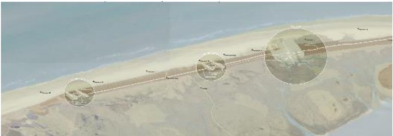
Figuur 1: Maatregelen kerven en washover

Bij de aanleg zal een deel van de zeereep die nu vooral bestaat uit vergraste Witte duinen (H2120) met lokaal Duindoornstruweel (H2160), verdwijnen om plaats te maken voor kwelder en zilte graslanden (H1330A). Deze kwelder en zilte graslanden zullen, door de regelmatig optredende overstromingen en de verstuingen van goede kwaliteit zijn. Deze grootschalige ingreep brengt de natuurlijke dynamiek terug.