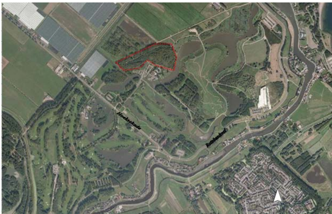
Figuur 2.1 Ligging heuvel B

De locatie ligt in het recreatiegebied Hoge Bergse Bos in Bergschenhoek. In figuur 2.1 is de ligging van heuvel B op een luchtfoto weergegeven.