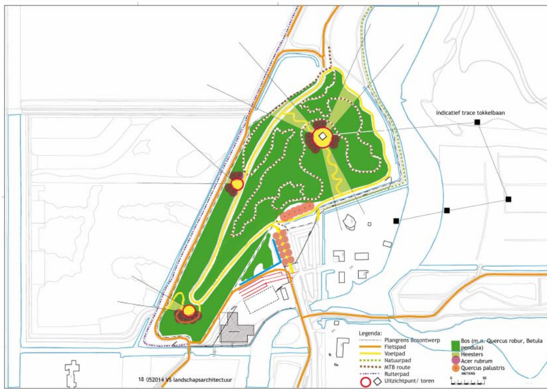
Figuur 2.3 Schetsontwerp

Het kaartmateriaal van het voorlopig ontwerp uit figuren 2.3 is opgenomen in bijlage 4.