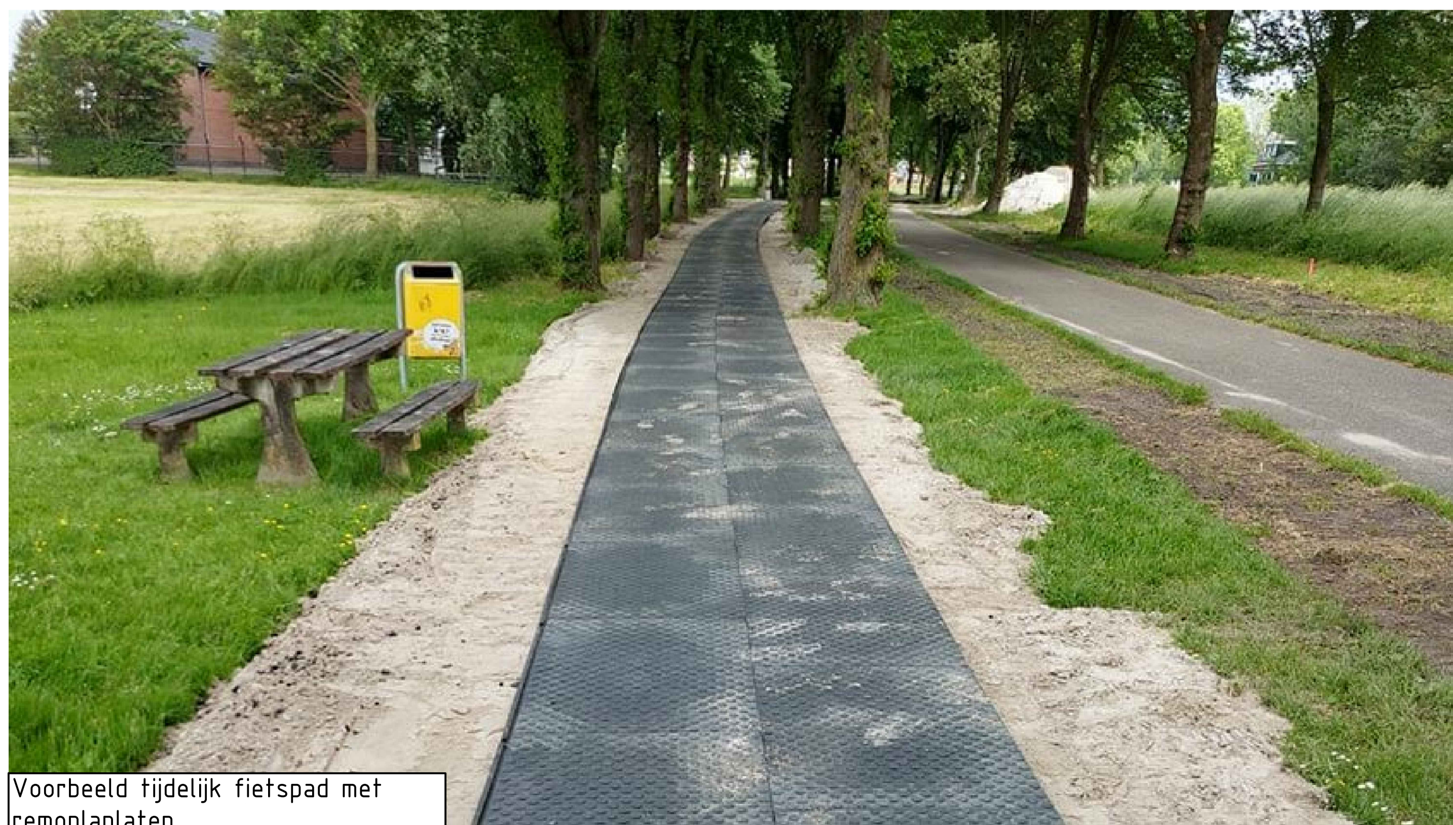
Voorbeeld tijdelijk fietspad met remoplasten