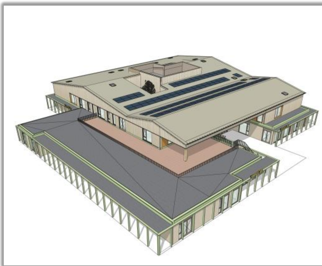
Figuur 2 isometrie van de nieuwbouw