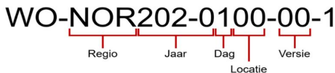
Figuur 1: Identificatie van een WO

WO's zijn identificeerbaar via een bepaalde logica (Figuur 1). De benaming is gebaseerd op respectievelijk de regio, het jaar, de dagsoort en de locatie waarop de WO zich primair bevindt. Tabel 1 bevat een overzicht van de afkortingen. Voor onderhoudsmomenten die zijn bedoeld voor het reinigen van perronsporen ("papierprikken" in de volksmond) of voor momenten die voornamelijk overdag plaatsvinden (dagwerk) worden de dagcodes 8 en 9 gebruikt. Ingaande dienstregeling jaar 2021 wijzigt de dagcode 7 naar dagcode 0.