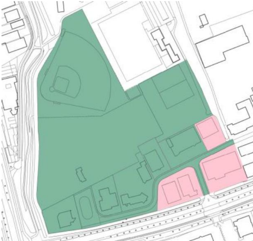
Afbeelding 2: onderzoeksgebied in eigendom van gemeente

Ook moet er in het onderzoeksgebied een (elektra)inkoopstation worden gerealiseerd. De exacte locatie van het (elektra) inkoopstation is nog niet bekend. Het uitgangspunt is dat deze vanwege bereikbaarheid gepositioneerd wordt aan de Rooseveltlaan. De exacte afmetingen van dit inkoopstation zijn nog niet bekend.