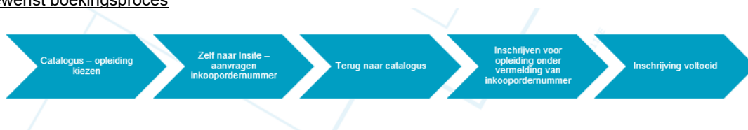
Figuur 2: Gewenst proces.