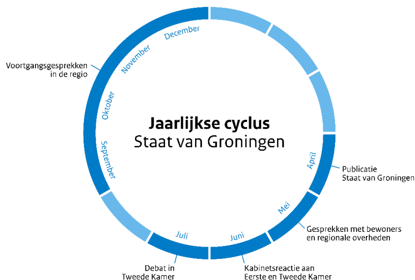
Figuur 1 In 2026 zal de SvGND eenmalig in mei verschijnen, waardoor ook de vervolgstappen opschuiven in de tijd. Het debat met de Tweede Kamer der Staten-Generaal wordt door de Kamer zelf ingepland op een door de Kamer te kiezen moment, vóór of ná het zomerreces.

De SvGND beoogt een jaarlijks totaalbeeld te geven van de resultaten en voortgang op alle pijlers van het beleid (en voor zover van toepassing de hieraan ten grondslag liggende wettelijke taken voor de verantwoordelijke minister, zoals opgenomen in de Tijdelijke Wet Groningen, waarvoor thans een wijzigingswetsvoorstel in voorbereiding is). 2 Dit zijn vijf pijlers: