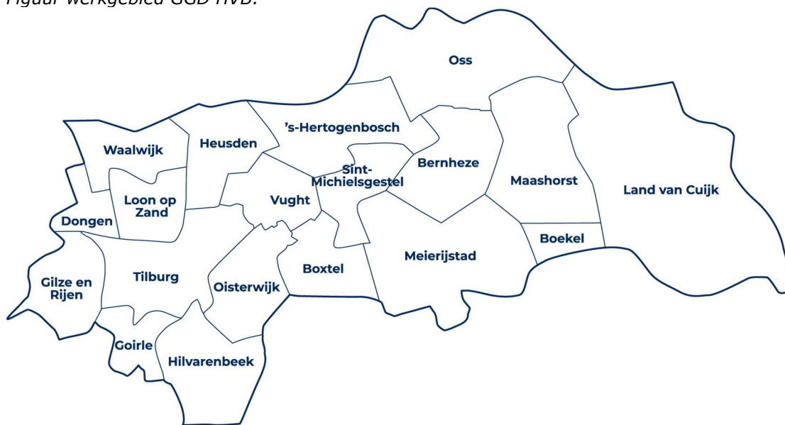
Figuur werkgebied GGD HVB:

We richten ons op de publieke gezondheid: de taken die de overheid op zich neemt om de gezondheid van iedereen te beschermen, bevorderen en bewaken, zonder dat mensen daar altijd om vragen. Dat doen we in opdracht van onze 19 gemeenten in Midden-Brabant en Brabant-Noord met ruim 850 gemotiveerde professionals voor meer dan 1,1 miljoen inwoners. Daarbij hebben we aandacht voor mensen die meer hulp nodig hebben, bijvoorbeeld omdat ze kwetsbaar zijn of zorg mijden.