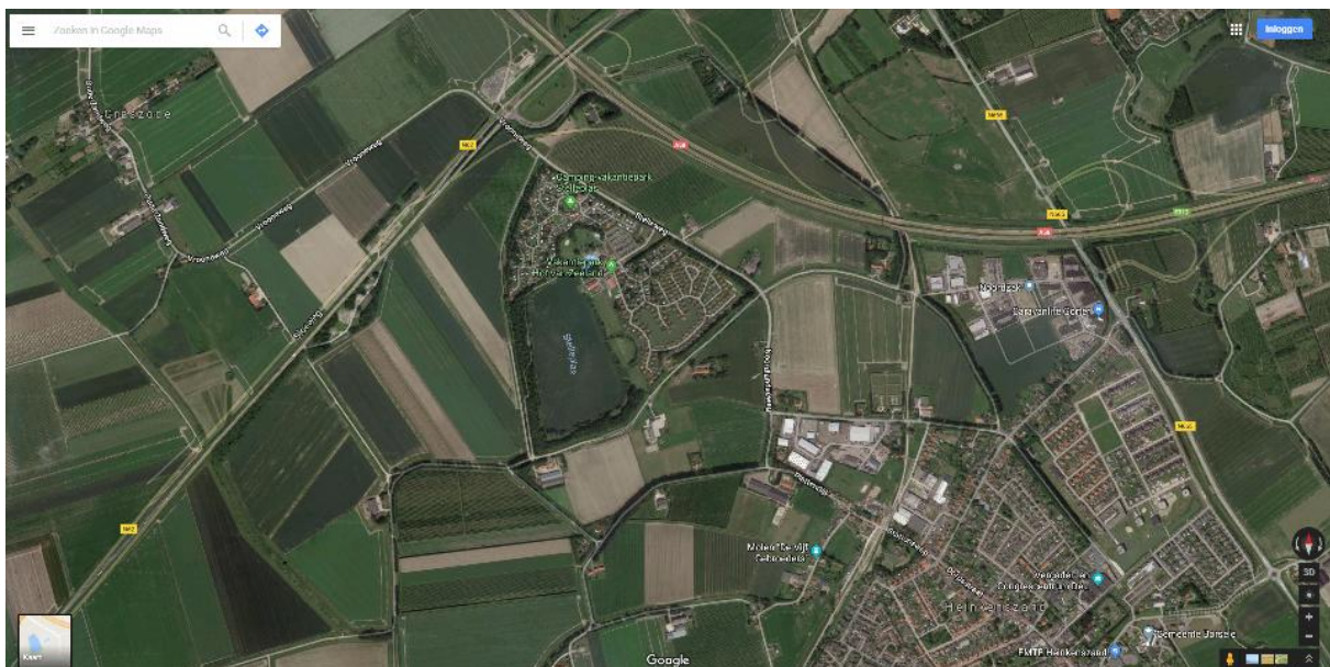
Figuur 1: De ligging van de Stelleplas, in de kom van de A58 en N62 en rechtsonder het dorp Heinkenszand

In de Stelleplas, gemeente Borsele, wordt een bewegroute gerealiseerd. Dit is een uitwerking van de plannen voor de recreatieve hotspot Stellenplas. Een van de wensbeelden voor de recreatieve hotspot Stellenplas was om de Stelleplas, te transformeren van een bestemming met beperkte functies naar een sportieve, actieve zone met een hogere belevings- en attractiewaarde waar geregeld evenementen zijn. De Stelleplas zou een entree en ontvangst moeten zijn voor het Landschapspark Borsele, het vroegere Waardevolle Cultuur Landschap. De Stelleplas is eind jaren zestig/begin jaren 70 gegraven voor de aanleg van snelwegen en kreeg in de loop van decennia een recreatieve functie. Rondom de Stelleplas is in de loop van de tijd een aantal vakantieparken/campings gebouwd. De locatie bevindt zich in de bocht van de N62 en de A58, en goed bereikbaar via de A58, afslag Heinkenszand.