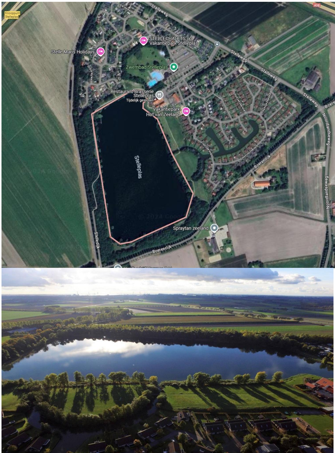
Figuur 2 en 3: De Stelleplas op google maps en panorama van de Stelleplas

onder begeleiding. Met de beweegroute geeft de gemeente Borsele verder invulling aan het sportieve en actieve wensbeeld voor de recreatieve hotspot Stelleplas.