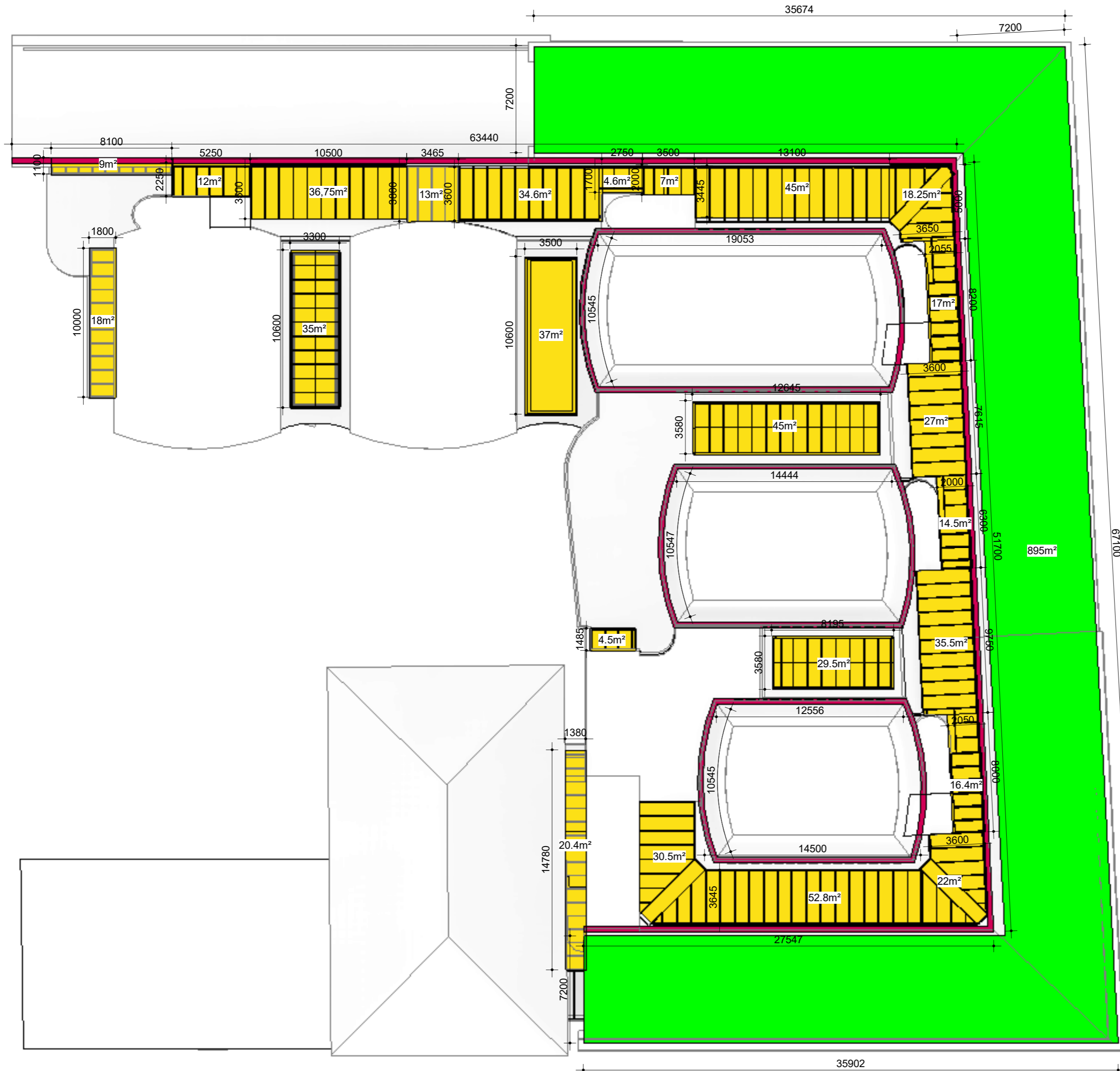
Dakplan 1 : 200