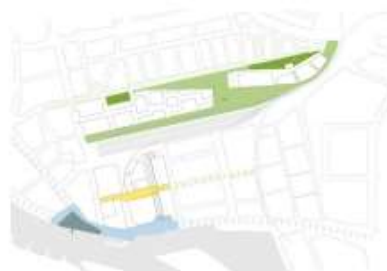
Spoorpark, Broekplantsoen, Hartlijn en Rijnboulevard