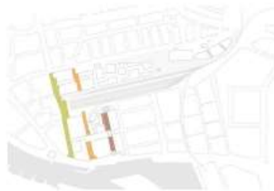
Van Oldenbarneveldtstraat, Dwarsloper en Historisch ensemble