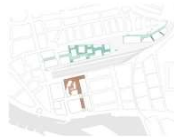
Dwaalmilieu en historisch ensemble