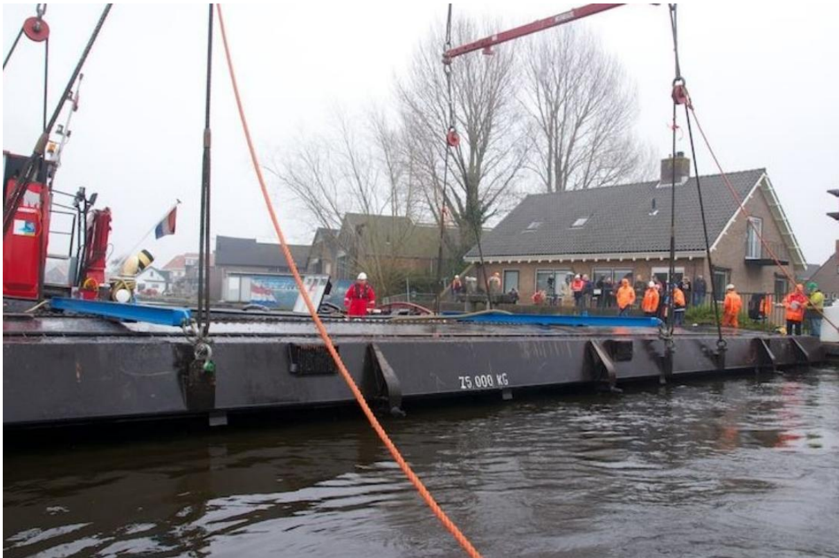
Foto lichten balgstuw Aalsmeer 2014

In 2014 is de stalen bodemkist van de balgstuw in Aalsmeer verwijderd en niet meer teruggeplaatst. Op deze locatie dient een nieuwe bodemkist te worden gemaakt en geplaatst.