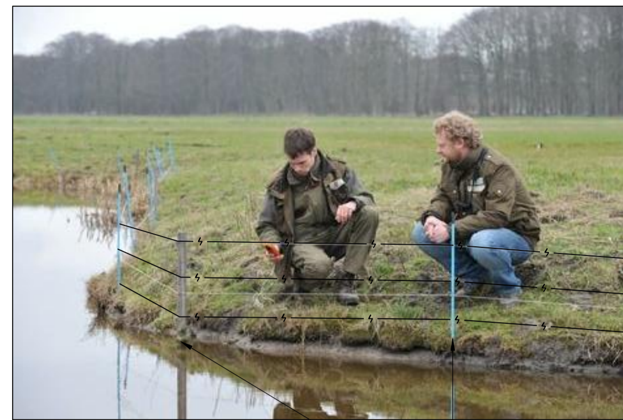
detail semi-permanent vossenraster schaal n.v.t.

aanbrengen 3 stroomdraden op een hoogte van 0.10, 0.25 en 0.40 m boven maaiveld