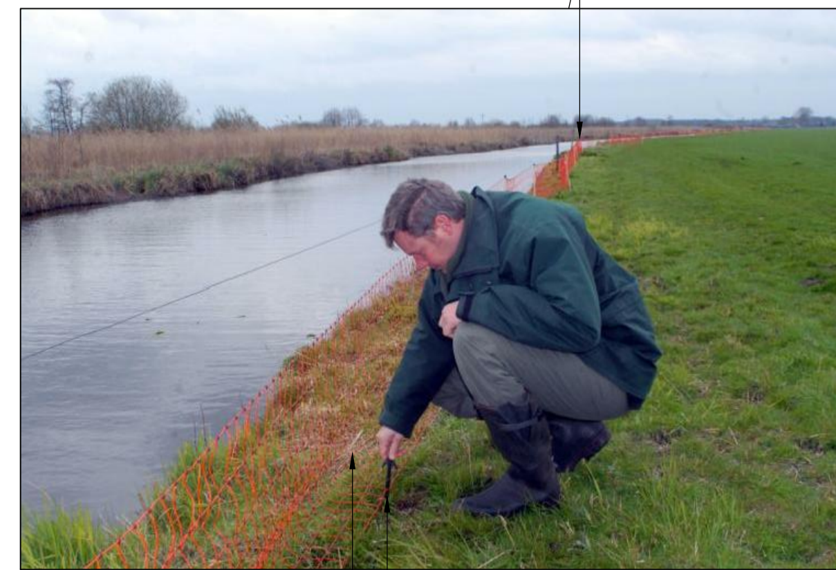
detail tijdelijk ganzenraster schaal n.v.t.

aanbrengen permanente houten palen op hoekpunten en op rechte stukken om de 100 m