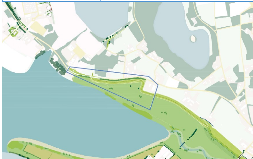
Figuur bij betaalpost 'Werkzaamheden...met potentieel raakvlak met Kampergeul