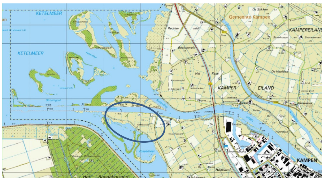
Figuur 1: Ligging Ketelpolder binnen IJssel-Vechtdelta, gemeente Kampen.

De Ketelpolder is onderdeel van de IJsseldelta, het uitstroomgebied van de IJssel in het Ketelmeer (zie Figuur 1). Ten zuiden wordt de polder begrensd door het Vossemeer, ten noorden door de IJssel. Het Vossemeer staat in directe verbinding met het IJsselmeer en zal op afzienbare termijn ook via het Reevediep een bypass bieden voor waterafvoer vanaf de IJssel naar het IJsselmeer.