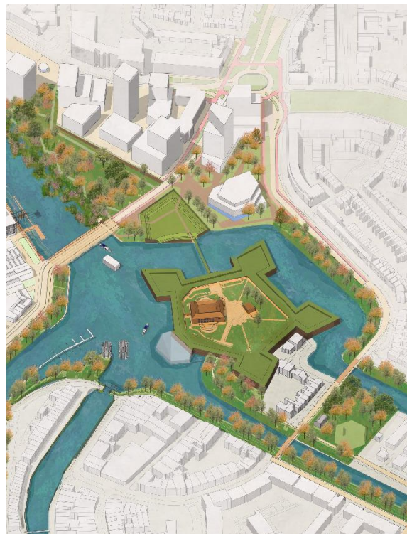
Voorbeeldverkaveling in 3d (uit Gebiedspaspoort Citadelpoort 2024)