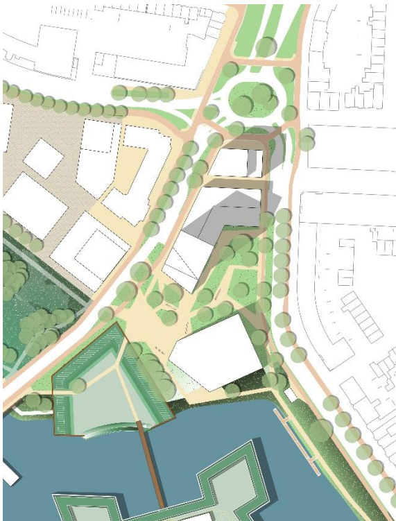
Ruimtelijke Structuurkaart (uit Gebiedspaspoort Citadelpoort 2024)

Het Ravelijn bruist tijdens een evenement. Is er geen evenement, dan genieten bewoners en bezoekers hier van het groen, water en het prachtige uitzicht. Tussen het museum en het Ravelijn kan extra water worden gerealiseerd, zodat het verdedigingswerk nog beter herkenbaar wordt. Zo geven we ook cultuurhistorie extra aandacht. Om de Citadelpoort te realiseren wordt het woonhofje (Citadellaan 40 t/m 58) gesloopt en het MS/MS station en de roeivereniging worden verplaatst. Het monumentale benzinstation aan de Citadellaan krijgt een nieuwe bestemming.