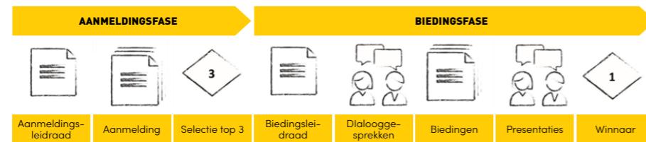
Figuur 1 Schematische weergave van tenderprocedure

Een schematische weergave van de onderhavige tenderprocedure ziet er als volgt uit: