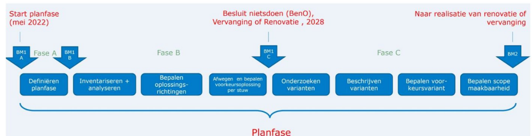
Figuur 1: Weergave van de fasering gedurende de gehele planfase van VenR Stuwen Maas

Zoals reed omschreven heeft Rijkswaterstaat een standaard werkwijze ontwikkeld voor de VenR projecten, het VenR proces. Dit proces is op verschillende onderdelen specifiek gemaakt voor dit project en werkt toe naar de verschillende beslismomenten zoals genoemd in paragraaf 2.1.1. De verschillende onderdelen en bijbehorende beslismomenten zijn weergegeven in onderstaand figuur.