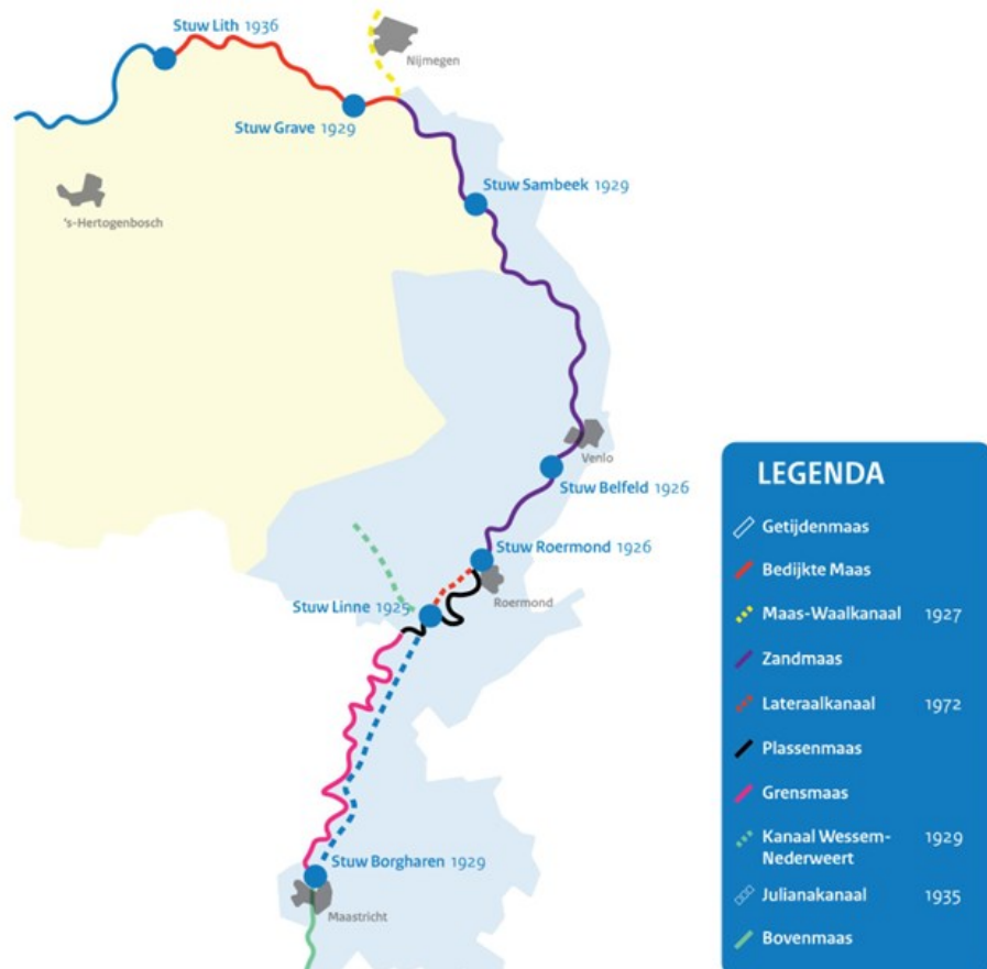
Figuur 1: Overzichtskaart stuwensysteem Maas

Tussen 1915 en 1942 heeft Rijkswaterstaat op 7 locaties stuwen en sluisen gebouwd, zodat de Maas bevaarbaar werd. Door de stuwen kan aanbesteder het waterpeil in de Maas kunstmatig hoog houden. Het waterpeil wordt 24 uur per dag in de gaten gehouden. Met beweegbare schuiven in de stuwen kan aanbesteder meer of minder water doorlaten. De Maas komt vanuit België Zuid-Limburg binnen en staat daar gemiddeld 44 m boven Normaal Amsterdams Peil (NAP). Bij de laatste stuw in het Noord Brabantse Lith is dit 1 m boven NAP. Door de 7 stuwen daalt het water geleidelijk zodat de Maas, ook in tijden van droogte, relatief lang bevaarbaar blijft.