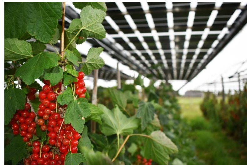
Figuur 4: Voorbeeld zonnepark gecombineerd met landbouw

“Eén van de uitzonderingsgronden voor landbouwgrond wordt toegekend aan “Agri-pv: combinatie van een substantiële agrarische functie met een zonnepark”. De onderbouwing voor wat substantieel is, ligt wat ons betreft bij de initiatiefnemer. Verder moet in ieder geval de hoofdbestemming landbouw zijn, waarbij de locatie ook daadwerkelijk agrarisch wordt gebruikt. Begrazing met schapen als groenbeheer valt hier bijvoorbeeld niet onder, maar teelt van gewassen onder of tussen de panelen wel.