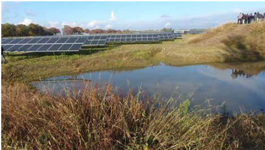
Figuur 6: Voorbeeld zonnepanelen met water

3.4c Het inrichtingsplan heeft ecologische meerwaarde voor het gebied. In de omgevingsvisie Nijkerk 2040 is dit gebied ook aangewezen voor het ‘versterken van de biodiversiteit’. De initiatiefnemer werkt uit in het plan hoe een bijdrage geleverd wordt aan het versterken van de biodiversiteit ter plaatse of in de omgeving van het zonnenveld.