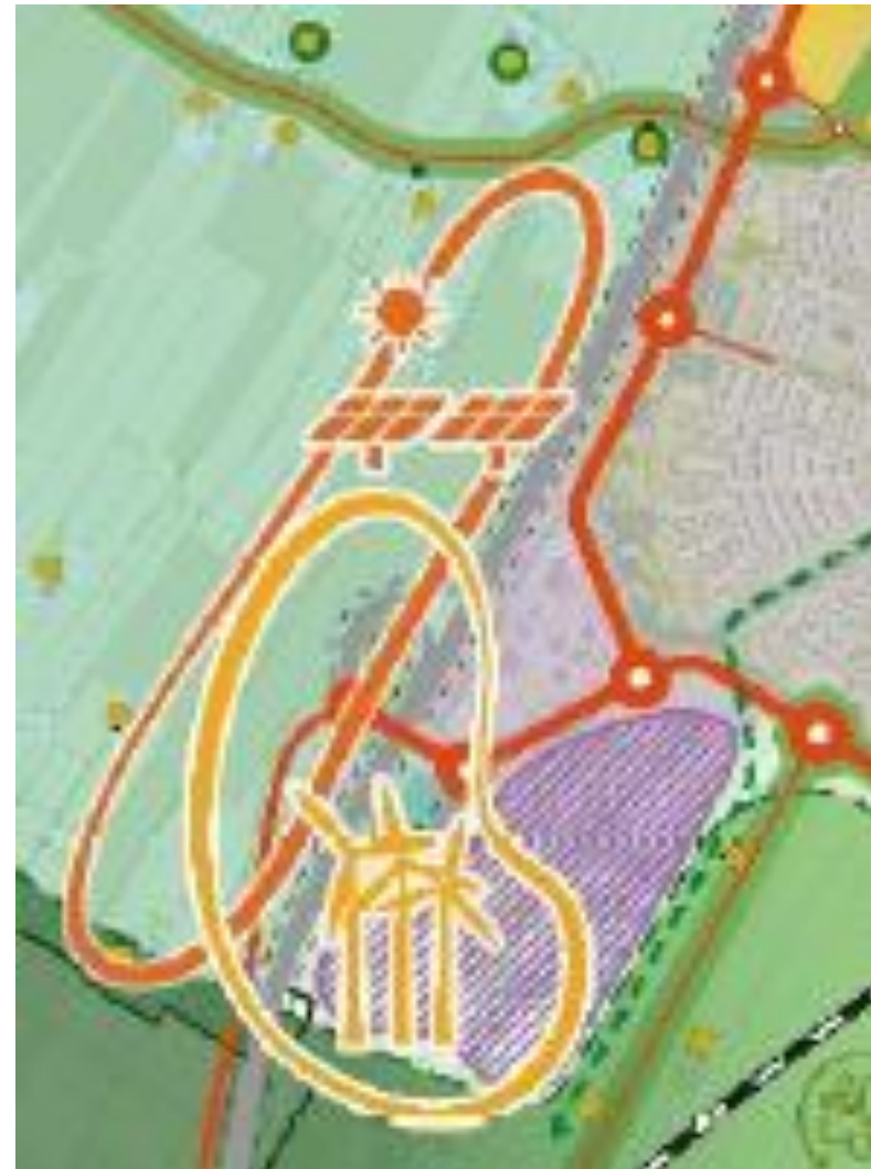
Figuur 2: uitsnede Kaart Omgevingsvisie Nijkerker 2040

Voor de van toepassing zijnde selectiecriteria wordt verwezen naar het toetsingskader in hoofdstuk 3.