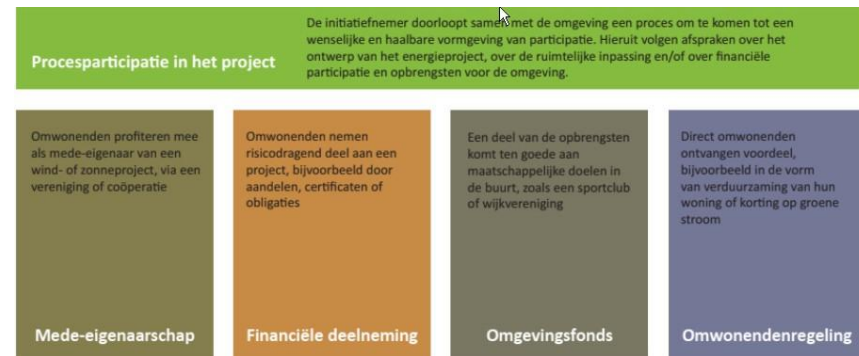
Figuur 7: Participatiewaaiër

Nijkerk eist minimaal 51% lokaal eigendom in productie en zeggenschap in een opwekproject. Dus ook minimaal 51% lokale financiële participatie. Hiervoor is onlangs het beleidskader lokaal eigendom vastgesteld.