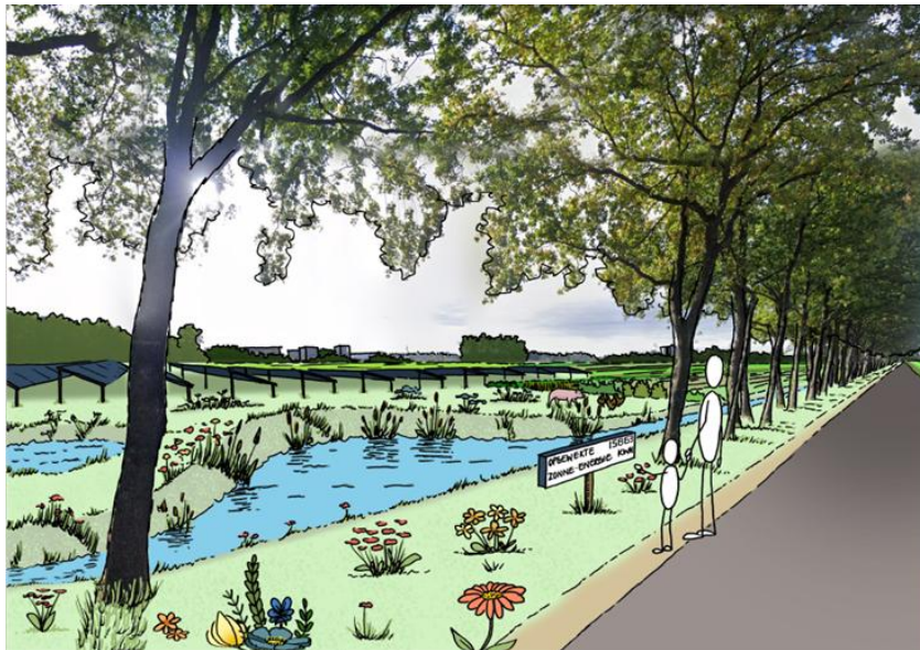
Figuur 3: Inspiratieschets zonneveld Nijkerk