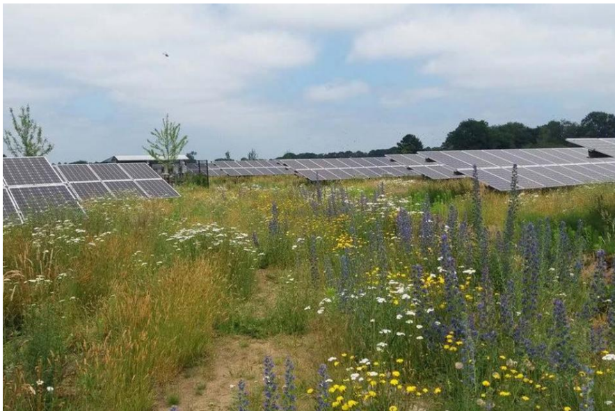
Figuur 1: Foto Solarpark de Kwekerij Hengelo (GLD)

In deze selectieleidraad vindt u achtereenvolgens de voorwaarden voor deelname (2), het toetsingskader met daarin de richtlijnen voor de aan te leveren informatie, uitgangspunten en randvoorwaarden aan de hand waarvan initiatiefplannen worden beoordeeld (3). De selectiemethode die we hanteren (4). Informatie over de planning en het vervolg (5) en tot slot de mogelijkheden voor inlichtingen en rechtsbescherming (6).