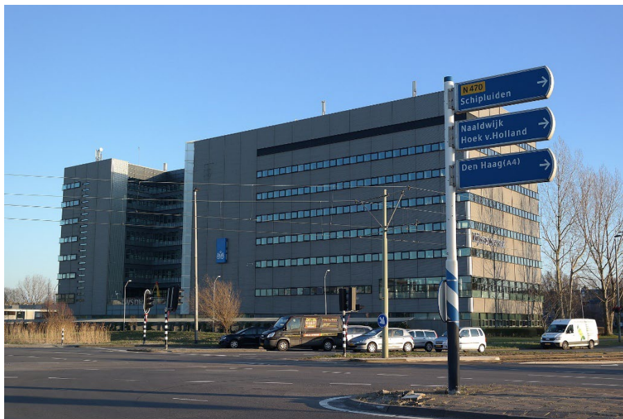
Aanblik Derde Werelddreef 1

Het gebouw wordt door de huidige gebruiker gezien als een waardevol kantoor door de centrale ligging, nabijheid van lokale samenwerkingspartners (o.a. TU Delft) en de omgeving is een vestigingsplaats van veel werknemers. Ondanks de moderne presentie van het gebouw zijn er verscheidene zaken die ervoor zorgen dat de werkomgeving en ondersteunde gebieden niet optimaal gebruikt kunnen worden. Dit komt doordat het gebouw nog gebaseerd is op oude normen, daarnaast zijn er verscheidene knelpunten die het gebruik belemmeren.