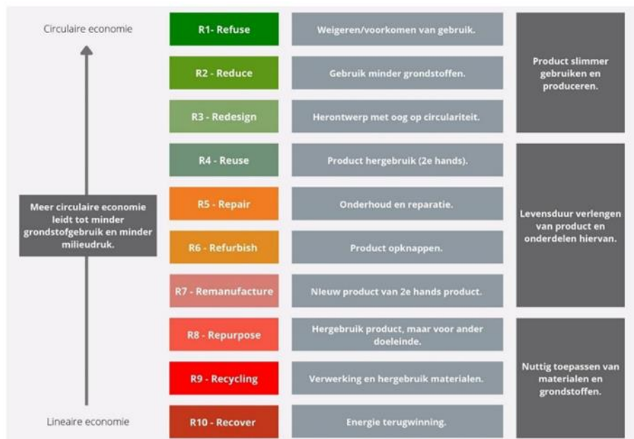
Figuur 2. R-ladder