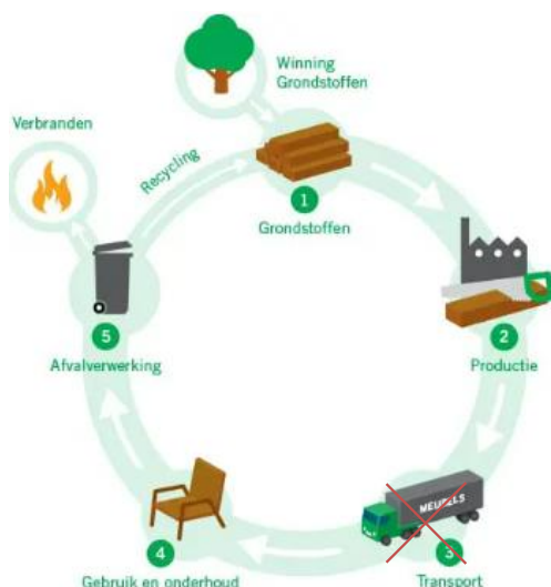
Figuur 1. Levenscyclus

Uw uitwerking baseert u op de punten uit figuur 1 met uitzondering van punt 3 transport.