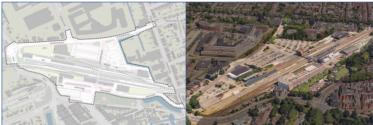
Figuur 1 | Huidige situatie stationsgebied

Als bijlage 1 treft u een inhoudelijke oplegger . Deze oplegger biedt een eerste overzicht van inzichten en uitgangspunten die tot op heden zijn opgedaan. Hiermee hebben alle inschrijvende partijen hetzelfde vertrekpunt en gaat waardevolle informatie niet verloren. In voorliggende procesbrief wordt daar waar nodig verwezen naar het betreffende hoofdstuk in de inhoudelijke oplegger. Daarnaast is een bijlage planstudies toegevoegd dat informierend een beeldend overzicht geeft van huidige uitwerkingen. Om een goed beeld te krijgen van de procedure adviseren wij om eerst deze procesbrief goed door te lezen en pas daarna alle bijlagen.