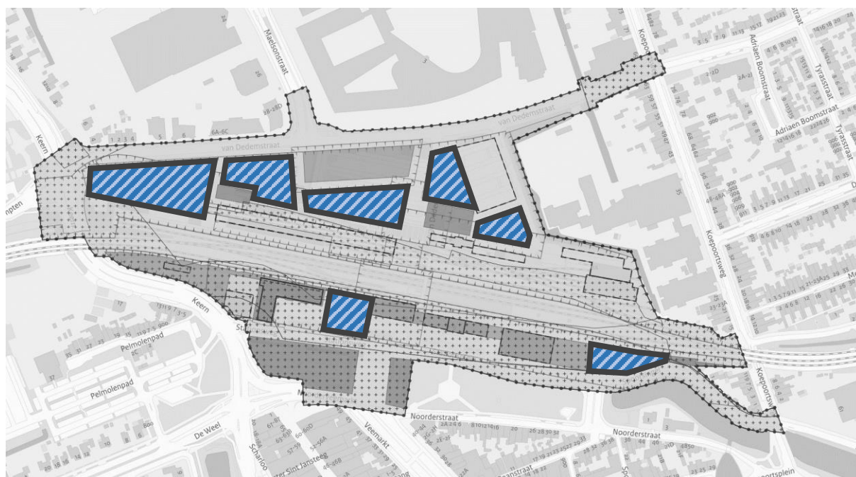
Figuur 3 | Scope partnerselectie: Contouren plangebied met ontwikkelvelden (koop- en ontwikkelrecht) voor de partner

Tijdens de haalbaarheidsfase denkt de partner mee over de visie op het hele stationsgebied en over alle programmaonderdelen (opstalontwikkeling wonen en maatschappelijk, inrichting openbare ruimte en de infrastructuurle voorzieningen). Nadat dit plan bestuurlijk is goedgekeurd wordt met de partner een Samenwerkingsovereenkomst gesloten waarin o.a. afspraken worden gemaakt over de voorwaarden waartegen de partner de ontwikkelvelden kan kopen ten behoeve van de ontwikkeling van de opstal (wonen, commercieel en maatschappelijk). Een en ander nader uit te werken in koop- en realisatieovereenkomsten per ontwikkelveld. De zeven ontwikkelvelden zijn weergegeven in figuur 3. De percelen worden door de gemeente bouwrijp opgeleverd. De gemeente realiseert de openbare ruimte en infrastructuurle spoorse voorzieningen samen met NS en ProRail (zie bijlage 1 hoofdstuk 6 voor specificatie rolverdeling gemeente – samenwerkingspartners).