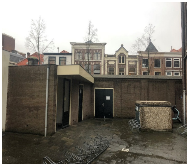
(Achterterrein Hartebrugkerk: huidige fietsenstalling)