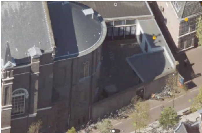
(Luchtfoto achterterrein Hartebrugkerk met Romanuszaal en tuinmuur)

Het projectgebied, midden in het centrum van Leiden, betreft het achterterrein van de Hartebrugkerk. Het is een binnenplaats met verschillende opstallen, waaronder de Romanuszaal. De ruimte is afgeschermd middels een tuinmuur. In de huidige situatie wordt deze ruimte gebruikt door de kerkparochie voor verschillende activiteiten. Op zaterdag wordt de binnenplaats gebruikt als pop-up fietsenstalling.