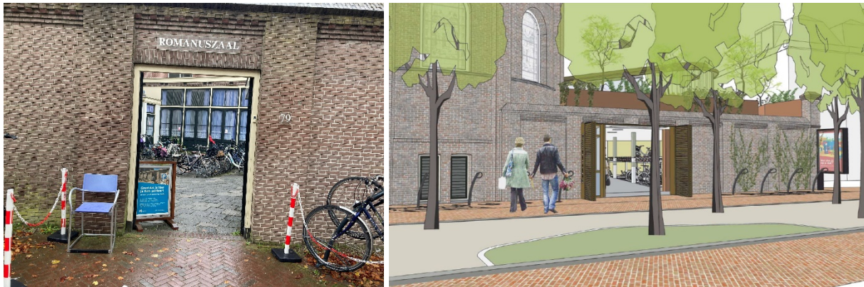
(Huidige ingang Romanuszaal en fietsenstalling) (Impressie nieuwe ingang fietsenstalling)

De nieuwe fietsenstalling, over het gehele achterterrein, heeft dan een netto vloeroppervlakte van ongeveer 330 m 2 en biedt ruimte voor ongeveer 350 fietsen. Daarnaast komt er in de bewaakte en afsluitbare stalling o.a. een integraal toilet, een beheerderslodge, diens toilet en lift. De nieuw te realiseren Romanuszaal zal een netto vloeroppervlakte van ongeveer 106 m 2 hebben met een groen dak.