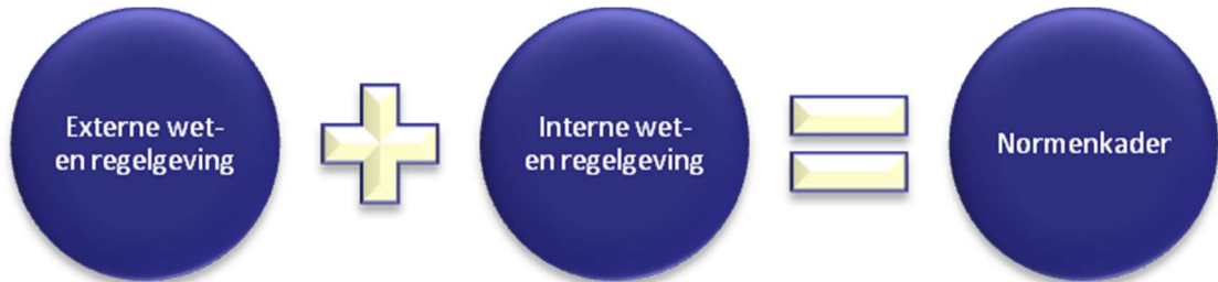
Figuur 1: normenkader

Voor een totaaloverzicht van alle kaders wordt verwezen naar het jaarlijks door de raad vastgestelde controleprotocol en naar de website www.overheid.nl .