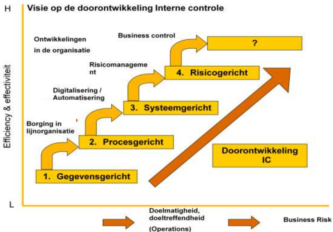
Figuur 2: Doorontwikkeling IC

Het grote voordeel hiervan is dat de betrokken afdelingen zelf verantwoordelijk worden voor het bewaken van de kwaliteit van hun producten, en sneller eventuele risico's of problemen inzichtelijk krijgen. Bij procescontrole wordt meer geleund op de beheersmaatregelen die binnen het proces worden vastgelegd en in mindere mate op de interne controle achteraf.