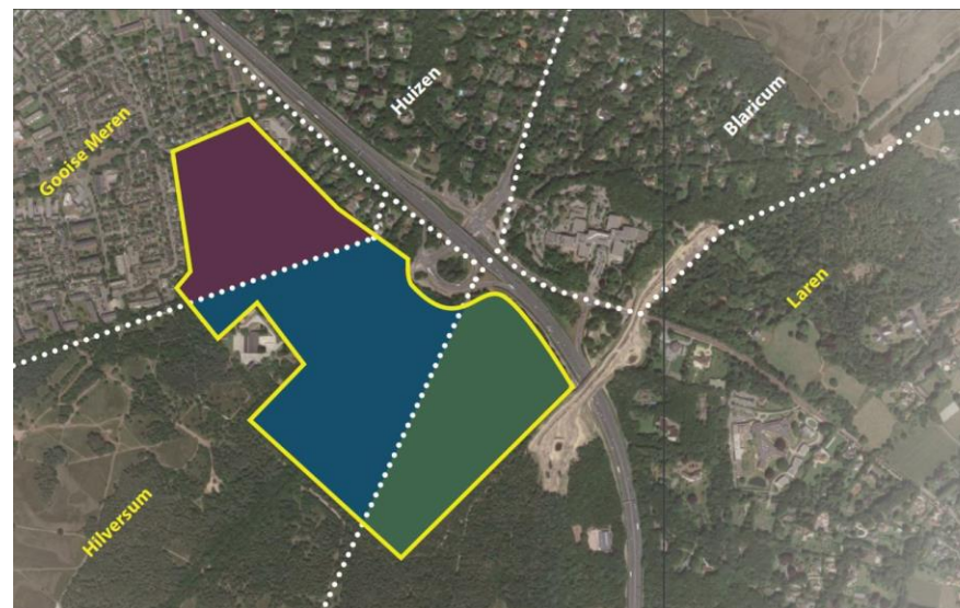
Weergave plangebied in de drie gemeenten Gooise Meren, Hilversum en Laren.

GEM Crailo B.V. is de zelfstandige projectorganisatie van de gemeenten Hilversum, Laren en Gooise Meren en houdt zich bezig met het ontwikkelen van plangebied Crailo, een voormalig defensie terrein, naar een gemengd woon-werkgebied met woningbouw, bedrijven en natuur tot 'Buurtschap Crailo'. Het plangebied ligt in drie gemeenten, te weten Gooise Meren, Hilversum en Laren.