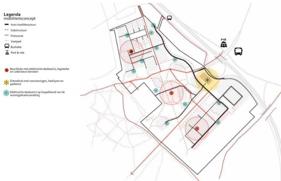
Mobiliteitsconcept Buurtschap Crailo