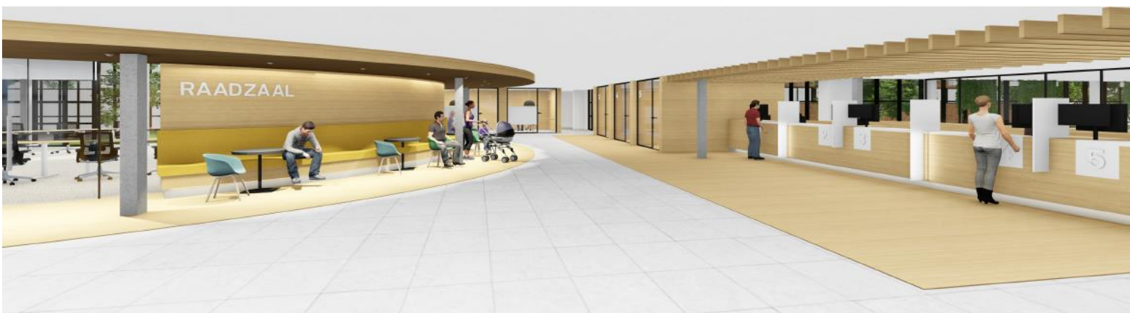
Impressie Raadzaal en Publieksbalies

De aanbestedingsprocedure vindt plaats volgens een Europese niet-openbare procedure op basis van hoofdstuk 3 van het geldende Aanbestedingsreglement Werken 2016 (ARW 2016). Daarmee is de procedure opgedeeld in twee fasen. In de eerste fase mogen alle geïnteresseerden een aanmelding indienen om deel te nemen, waarna er een selectie plaatsvindt op basis van uitsluitingsgronden, geschiktheidseisen en selectiecriteria. In de tweede fase worden per perceel de beste 5 partijen op basis van de rangschikking uit de selectiefase uitgenodigd (om) een inschrijving in te dienen.