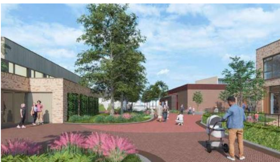
Afbeelding 3 Aanzicht project