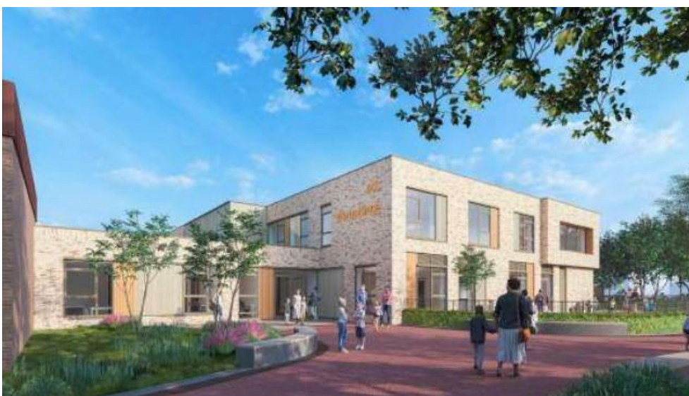
Afbeelding 2 Vooraanzicht project