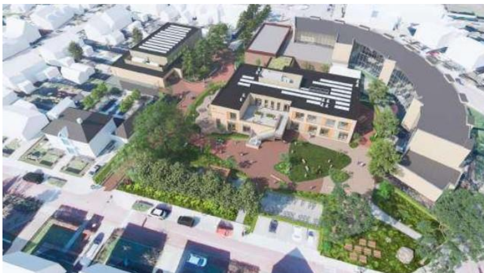
Afbeelding 1 Bovenaanzicht project